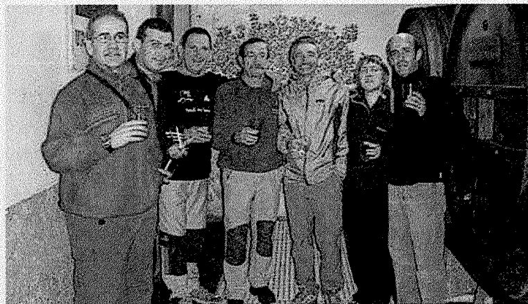
Mendia eta sagardotegia. Joan zen urtean 'Larregain' sagardotegian izan ziren eta aurten Astiazaran bisitatuko dute.

El precio por persona de la citada excursión será de 370 euros, de los cuales 170 se ingresarán en el