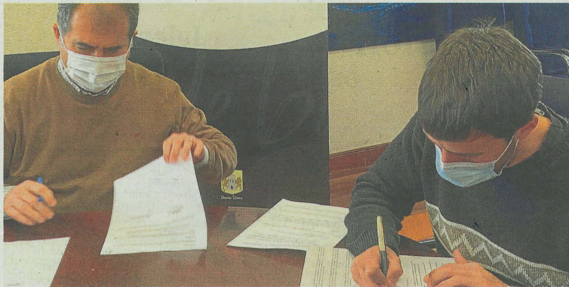
Momento de la firma del convenio entre el Ayuntamiento y la Fundación Alzheimer.