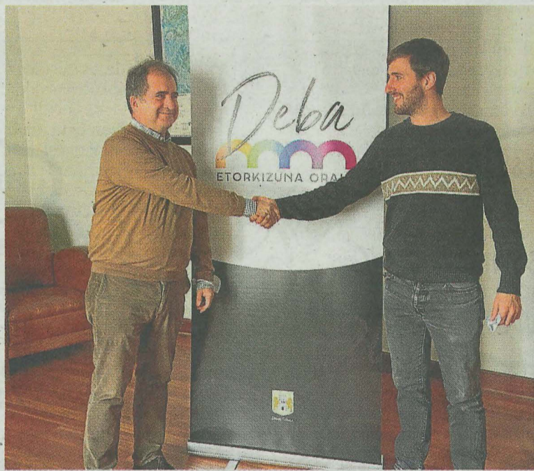
El acuerdo de colaboración, de momento, es por dos años.

Aportan conocimiento y entusiasmo para dar respuestas y soluciones innovadoras, fiables y útiles, en el campo del deterioro cognitivo y el envejecimiento cerebral, a los ciudadanos, enfermos, familiares, profesionales y administraciones. Siempre con responsabilidad y ética. El ámbito de actuación en investigación se basa en: diagnóstico precoz y los biomarcadores. Las fases preclínicas y los factores de riesgo. El desarrollo de nuevas terapias avanzadas y la promoción del envejecimiento saludable. La auto-