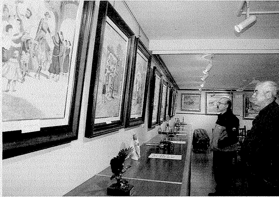
Asistentes a la exposición que se celebró el pasado año con motivo de la celebración. :: A. L.

En el programa se incluyen diversos campeonatos, que se dis-