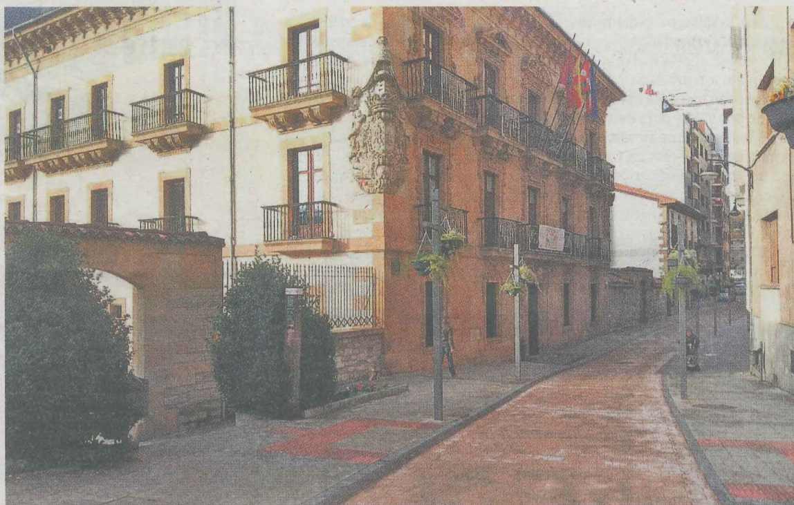
Edificio de la Casa Consistorial, donde se situará el nuevo servicio telefónico.

La medida tiene el objetivo de asegurar la comunicación pues se ha establecido un protocolo para que ninguna llamada se quede sin atender.