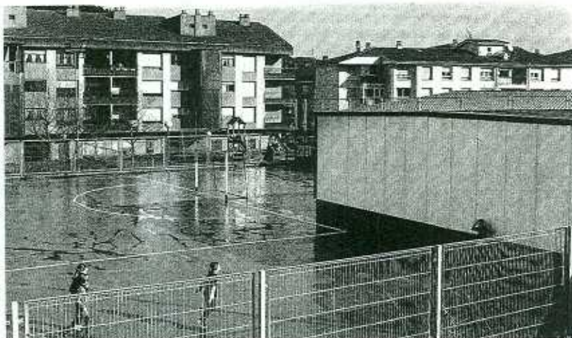
Escolares juegan en la escuela pública de Atxondo.

El Consistorio comunicó el cambio a la empresa de Correos, cuyos representantes se mostraron "encantados", ya que se mejorará el servicio. Las obras dieron comienzo ayer en la lonja que está cerca de la sociedad gastronómica de la plaza de los Fueros. La próxima oficina hace cantón. "Está al otro lado de la carretera de la ubicación actual de Correos", matizó el alcalde Atxondo. El traslado se prevé para marzo. > I. GORRITI