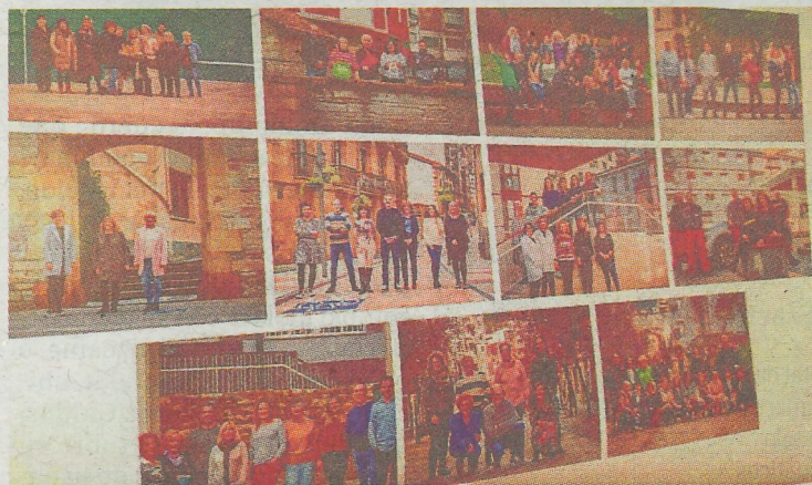
Ayudará al comercio local a tener un escaparate digital adecuado.

Las personas participantes conocerán los fundamentos del SEO (Search Engine Optimization), un conjunto de estrategias y técnicas de optimización que se hacen en una página web para que aparezca orgánicamente bien posicionada en buscadores, con las herramientas óptimas para cada caso, las palabras clave, el análisis de competidores, etcétera.