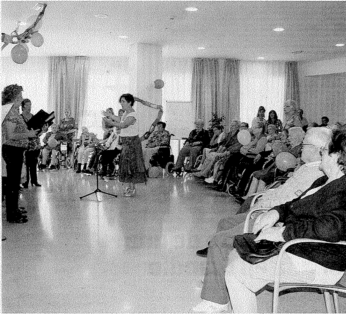
Los residentes, en una actuación coral organizada con anterioridad en el centro.