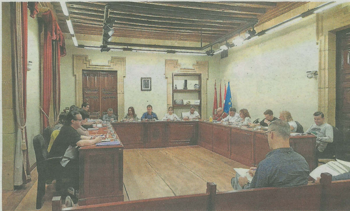
La corporación se reunió el pasado lunes, en sesión plenaria extraordinaria, para aprobar los impuestos. A. L.

Por otra parte, se incorporarán nuevas bonificaciones en las tasas de las instalaciones deportivas locales para alcanzar a las familias más vulnerables y que el mayor número de personas pueda practicar deporte en las instala-