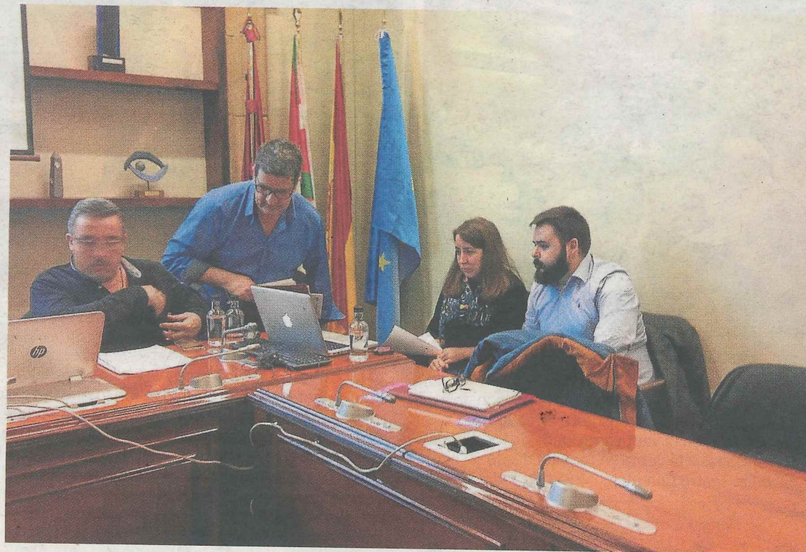
Los integrantes de Burulogy, durante la presentación de la empresa.

Trabajan en dos sectores. Por un lado se realizan sesiones presenciales, compuestas por grupos de 8 a 10 personas, que acuden dos horas semanales a estas reuniones. Los ejercicios que trabaja cada persona