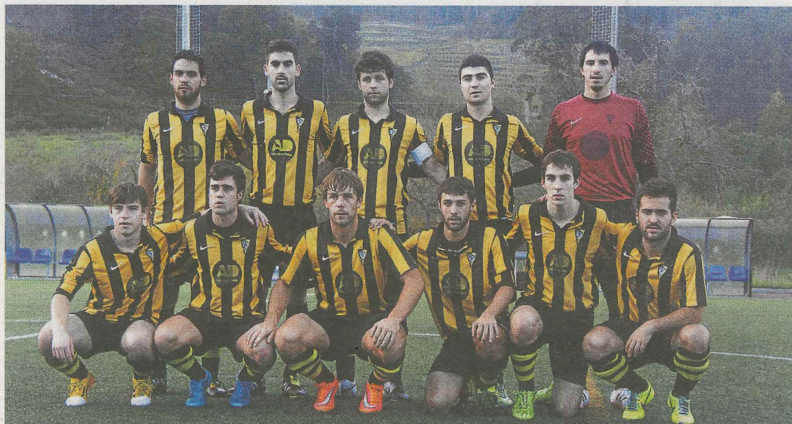
Once titular del primer equipo del Amaikak el pasado fin de semana.