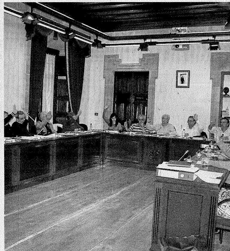
Los concejales ermueños votan en un pleno municipal.

der, como ya hizo en una anterior ocasión, que «el Ayuntamiento de Ermua sigue acumulando diferencias en su equipo de gobierno» y Lemberri calificó a los concejales de Bildu de «cuadrados» y afirmó tener «discrepancias, pero que pueden ser enriquecedoras».