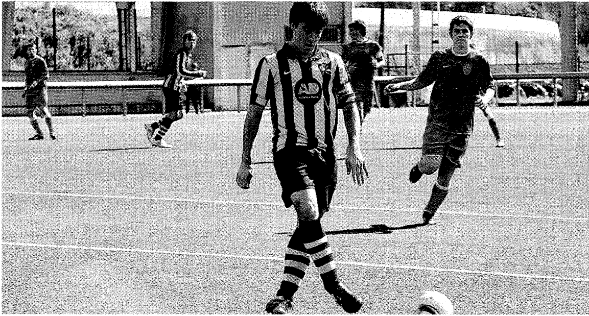
Los juveniles del Amaikak Bat se impusieron en Errota Zar al Urola.