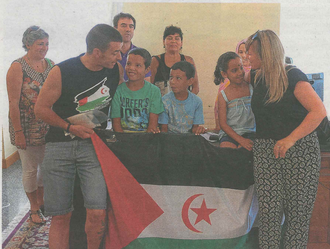
Acogida. Los tres pequeños fueron recibidos en el Ayuntamiento de Eibar a su llegada.

A pesar de intentarlo en años anteriores, esta era la primera ocasión en que la asociación eibarresa acogió a niños para el programa 'Vacaciones en paz' que trata de aliviar la vida de los niños y niñas en los meses más cálidos en los campos de refugiados próximos a Tindouf, en una