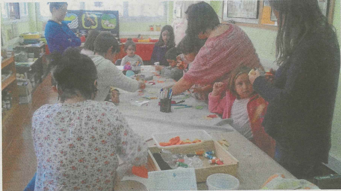
DebaNaturak eskeintzen duen eskulan tailerra joan den kurtsoan ere burutu zen.