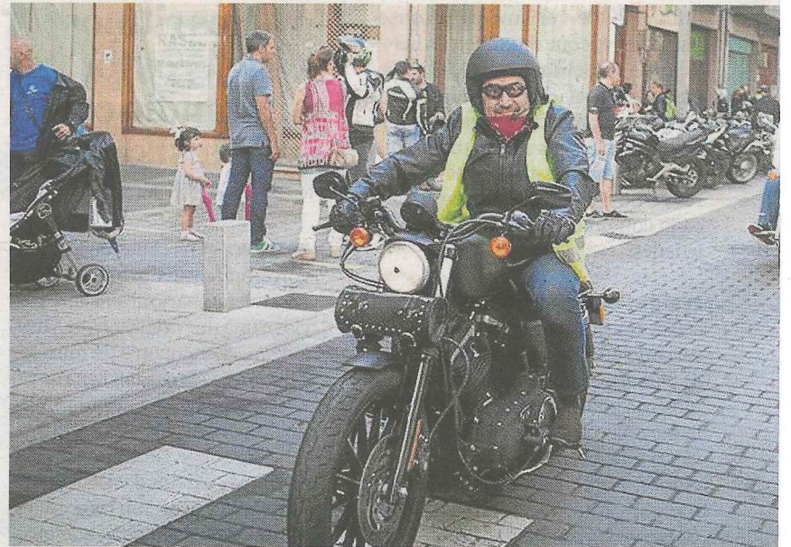
Un centenar de motoristas participaron en la concentración del