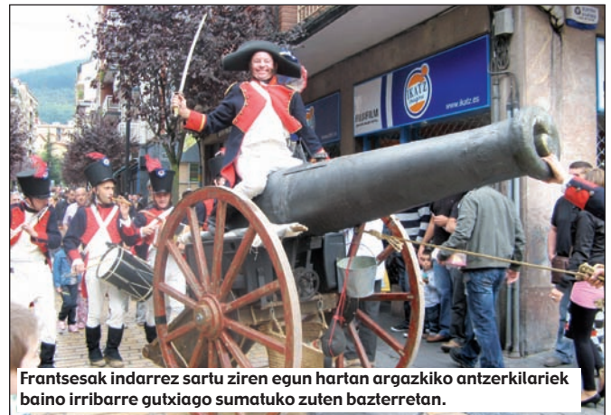
Frantsesak indarrez sartu ziren egun hartan argazkiko antzerkilariek baino irribarre gutxiago sumatuko zuten bazterretan.

Egunak 22 hildako eta 24 zauritu lagako ditu herritarren artean, orduan idatzitako eskuizkribuetan bandoleiros , paisanaje armado edota esclavos deitutako horien artean. Erasotzaileek, ostera, 200 gudari galdu zituzten bizkaitarren kontaktetan eta Gravierrek antza bestelako matematika sistema bat era-