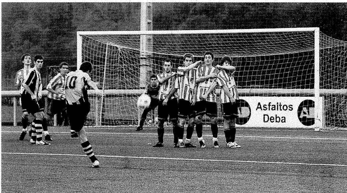
El Amaikak de Preferente lo intentó ante un Elgoibar bien plantado en el campo.