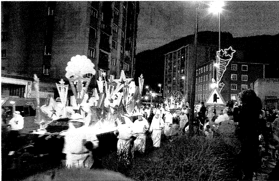
La Cabalgata de Reyes fue una de las actividades más seguidas por los ermuarra en Navidad. ■ A. L.

Cabe destacar que las novedades gustaron al público ermuarra que alabó que los Reyes fueran en carrozas en lugar de en caballos. Tras el éxito de la iniciativa los responsables municipales pretenden mantener esta novedad. «Este cambio