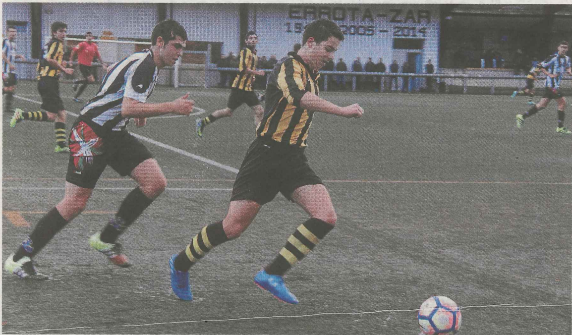
El equipo juvenil consiguió prolongar su buena racha frente al Zestoa.