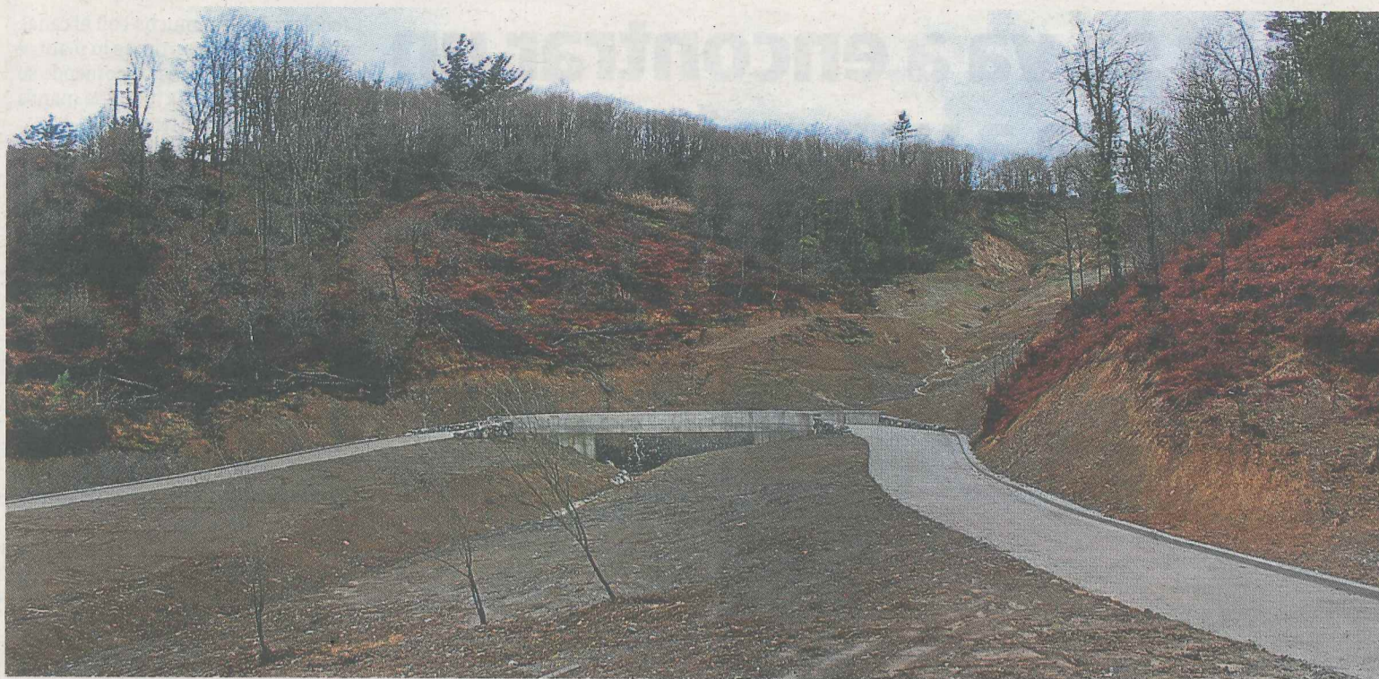
Zona en la que se produjeron los desprendimientos el pasado año.