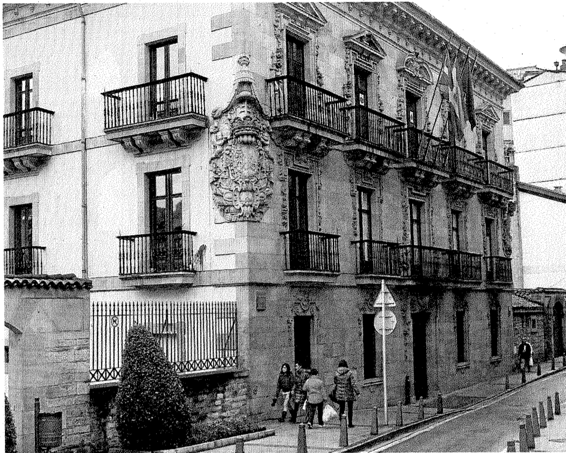
450 de las empresas contratadas por el Ayuntamiento están radicadas en Ermua. A. LASUEN

Por ello, en cuanto al origen de las empresas o personas adjudicatarias de estos contratos en 2012, 450 están ubicadas en Ermua (el 38,6%),