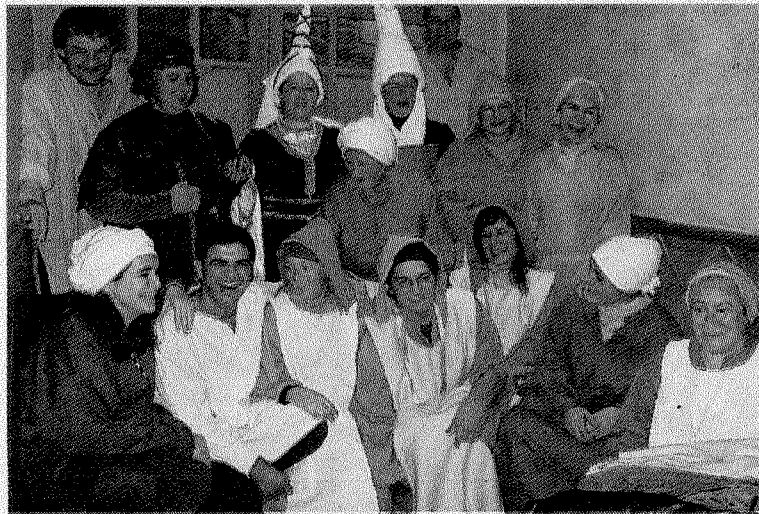
Goizeko Izarra eta Akelarre antzerki taldekoek eskuratu dute gaur saria. :: GORRITIBERIA