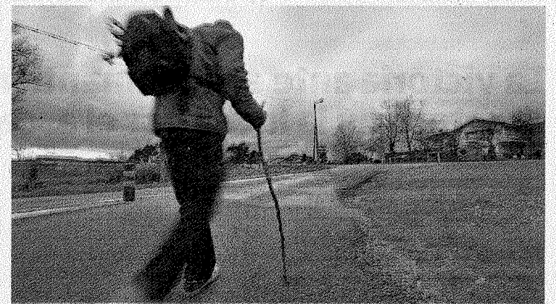
Peregrino a Santiago por el camino de la costa.

El edil del PP señaló que «desde el siglo IX y X hay constancia de peregrinos que optaban por el Camino del Norte en vez del Camino más tradicional, a partir del siglo XII este Camino comienza a ganar en importancia y por él fluyen muchos peregrinos que entran por Irun y atraviesan nuestros pueblos, entre ellos Ondarroa, pero que al no tener la ruta convenientemente señalizada provoca que muchos caminantes que atraviesan los lugares típicos no sean conscientes de