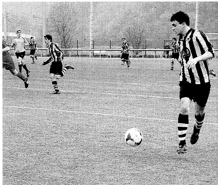
El Amaikak juvenil ganó al Ordizia en Errota Zar.

El juvenil perdió ante un gran Hernani que poco a poco fueron superando a las animosas jugadoras debarras, que tuvieron que desplazarse a unas horas muy tempranas.