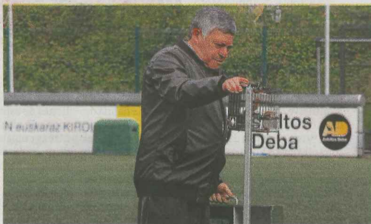
Participantes del concurso en Errota Zar.