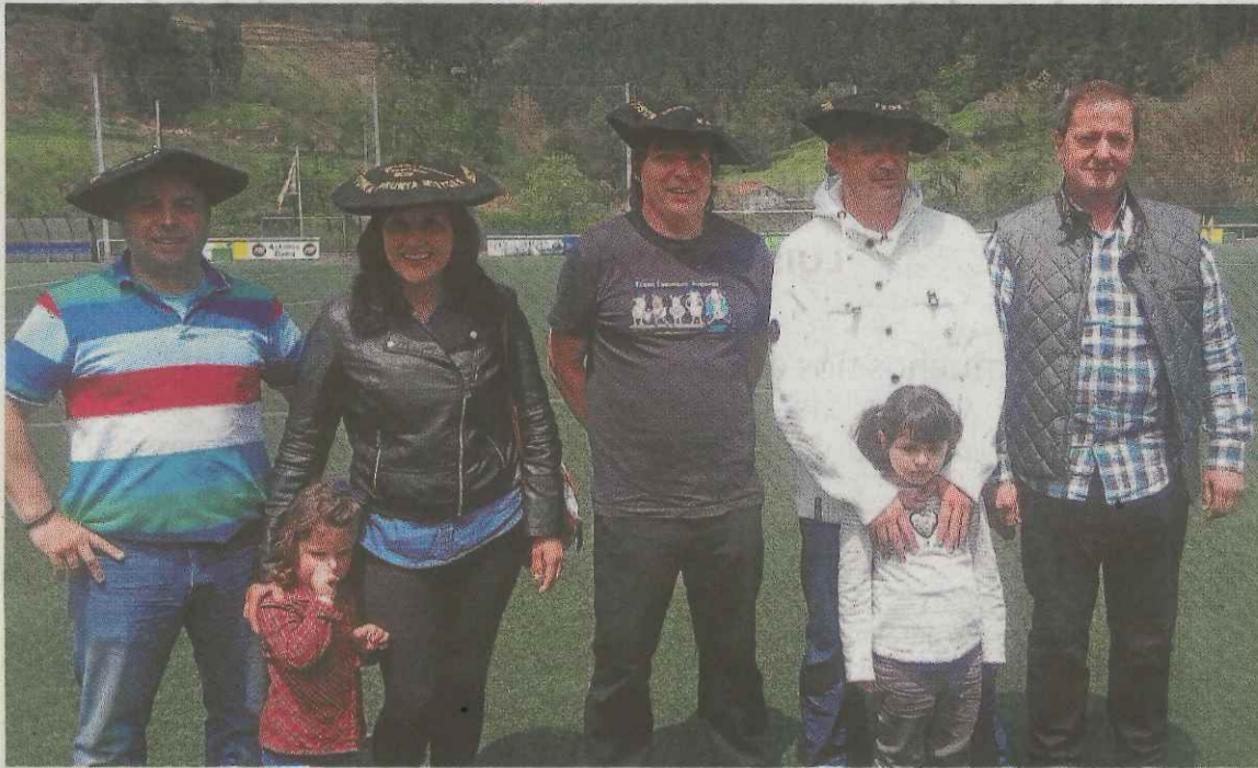
Los ganadores del concurso de pájaros cantores.