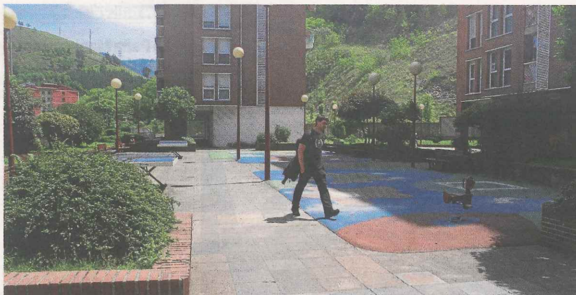
La comunidad de vecinos denunció que los juegos originaban filtraciones a los garajes.