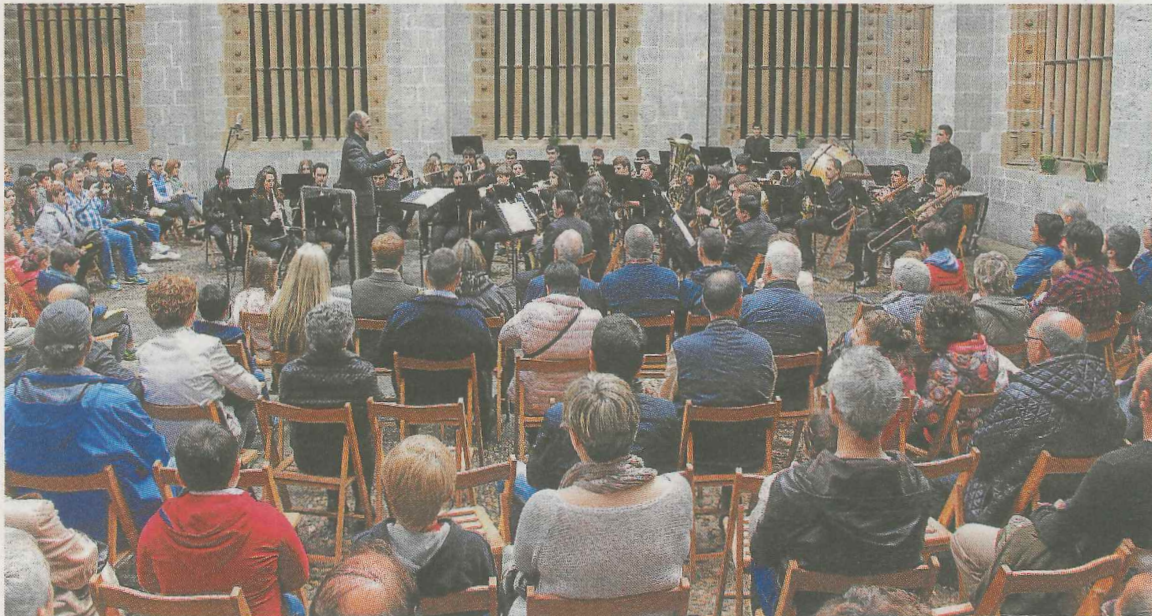
La Banda de Música local ofrecerá mañana un concierto en el claustro de Santa María.