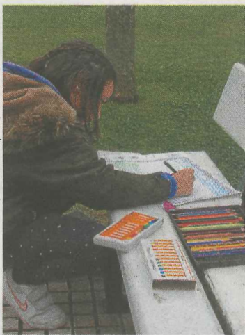
Concurso de pintura.