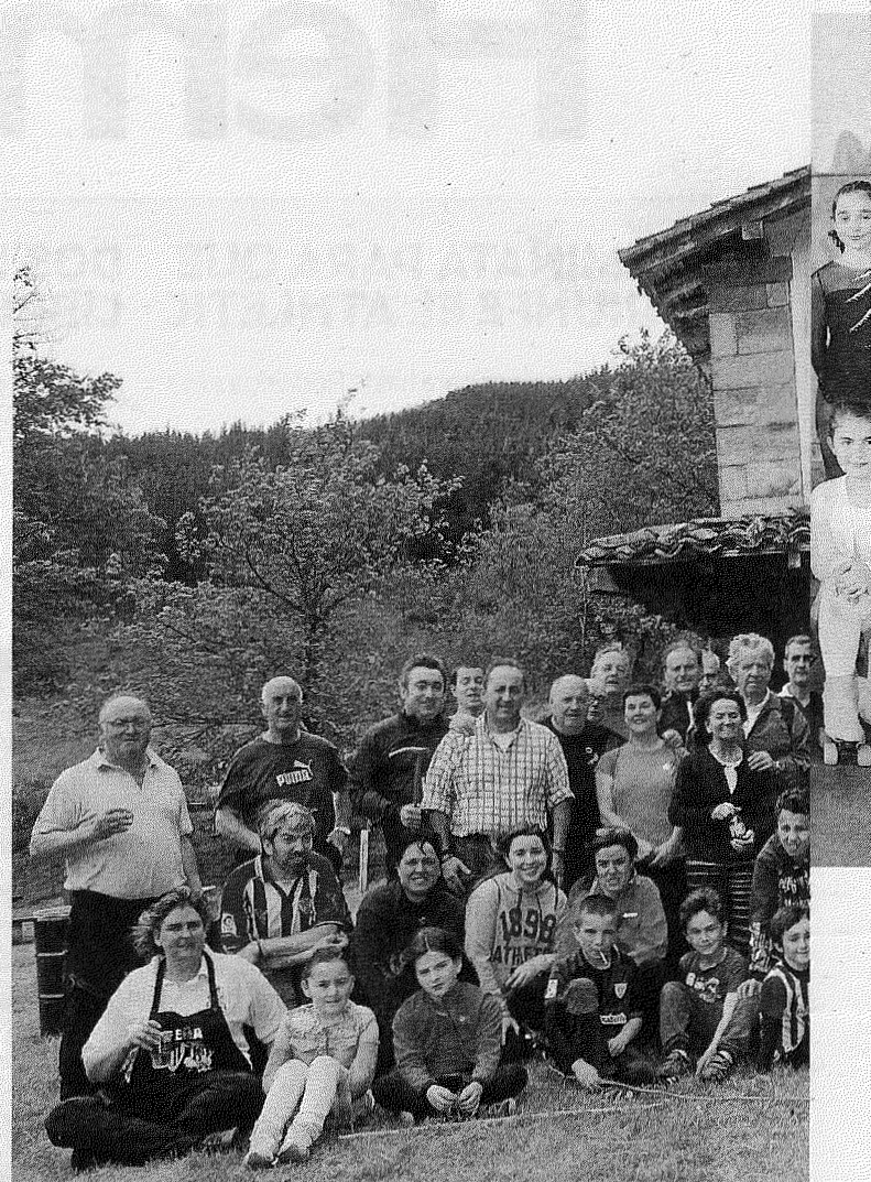
Foto de familia de la romería del año pasado frente a la