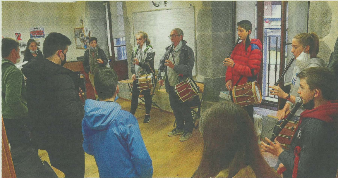
Txistuariak musika eskolako gela batean entsaiatzen. SALEGI