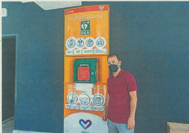
El alcalde de Ermua posa frente a uno de los nuevos dispositivos.

Los mecanismos se han instalado en el Centro de Salud local, el Hotel Villa de Ermua, la Travesía Andalucía número 3, Zubiaurre número 41, Izarra Centre, la plaza del mercado, el Centro Cívico Miguel de Unamuno y Errebalburu número 7.