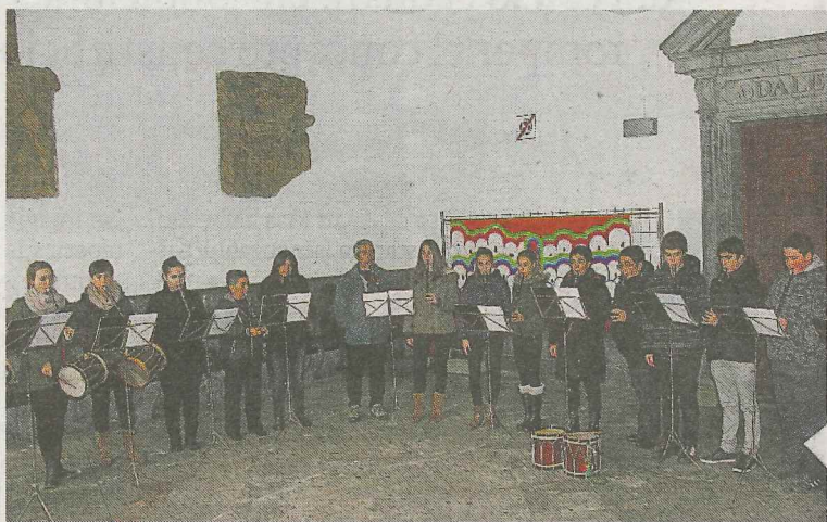
Txistularis debarras en una de sus actuaciones. ■ ANDER SALEGI

El programa de actividades comenzará el viernes muy pronto. Dos grupos se encargarán de dar los buenos días a todos los debarras. Los txistularis y los acordeonistas saldrán a primera hora de la mañana con sus dianas y recorrerán las calles del municipio con sus cancio-