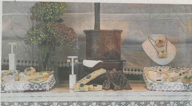
Escaparate de la Joyería Senén, ganador del concurso.

ría agrícola de San Martín, los productos que en ella se venden y el ambiente euskaldún que genera durante esta popular jornada festiva, para participar en el certamen que cada año cuenta con más éxito entre los comercios ermuañarras. Este año se han otorgado dos premios entre los numerosos participantes. El primero recayó en la Joyería Senén, mientras que el segundo ha ido a parar en la propuesta de decoración que presentó al concurso el escaparate del Estanco Solozabal.