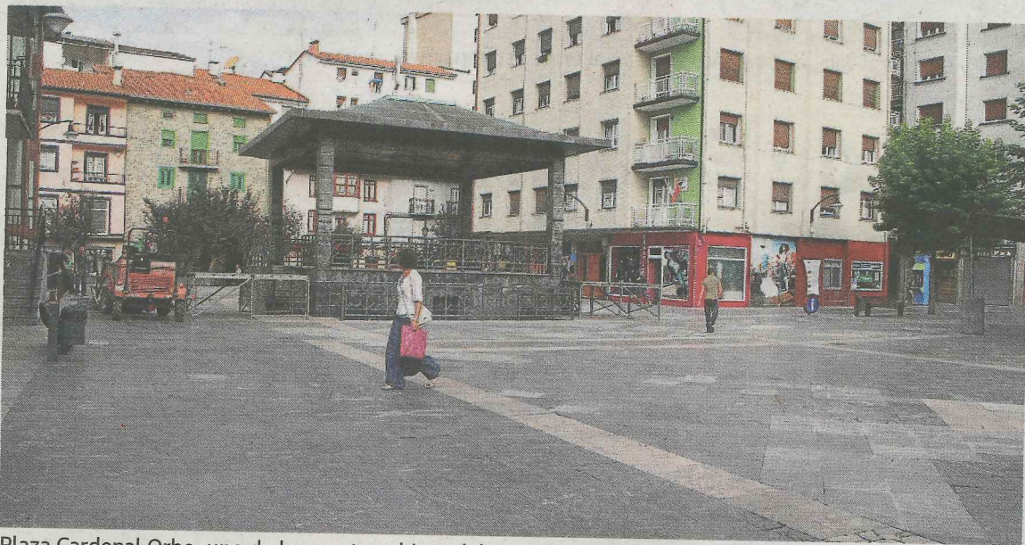
Plaza Cardenal Orbe, uno de los puntos objeto del estudio de ruido.

Cada prueba consistió en el disparo de una pistola de foguero y en la medición con el instrumental técnico especializado del tiempo de reverberación. Se realizaron varias pruebas en cada uno de los espacios. Estas servirán para complementar