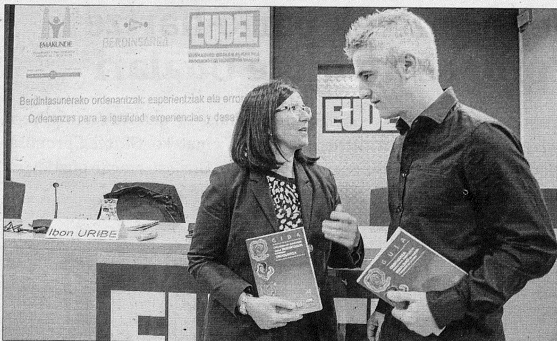
La directora de Emakunde, Izaskun Landaia junto al alcalde de Galdakao, Ibon Uribe.