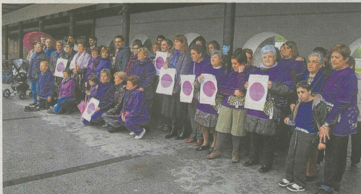
Manifestación celebrada contra la violencia de género.

El último de los eventos preparados por el Ayuntamiento con este fin se llevará a cabo al día siguiente. La charla sobre '¿Qué hacer ante la violencia contra las mujeres?' tendrá lugar en el Salón de los Espejos del Palacio Agirre, a partir de las 19.00 horas.