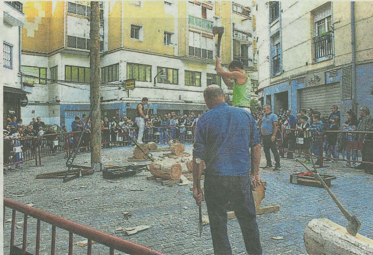
Los aizkolaris tampoco faltaron en la San Martín azoka del sábado. A.L.

La peña local del Athletic de Bilbao, Herri Muga, celebrará mañana su 25 aniversario. Para ello, contará con la colaboración de la txaranga local Iru-litxa, que llenará de música las calles centrales del municipio, de 13.00 a 15.00 horas y de 19.00 a 21.00 horas. Durante el fin de semana se colocará también una pancarta conmemorativa de este redondo cumpleaños en la plaza Cardenal Orbe y se celebrará una comida de los socios. Además, la peña ha sacado, para las personas asociadas, camisetas conmemorativas del aniversario, que en fechas posteriores podrá adquirir el resto de la población ermuarra.