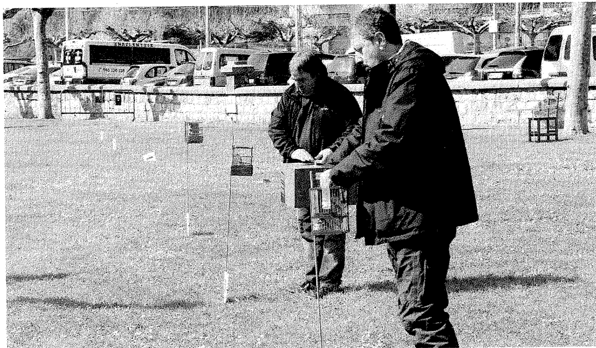
Dos participantes preparan sus pájaros para el concurso de canto. ** ANDER SALEGI