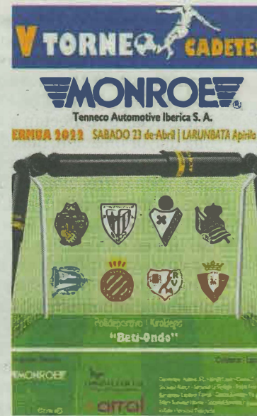
Cartel del campeonato.

El campeonato se dividirá en dos campos (Teodoro Zuazua