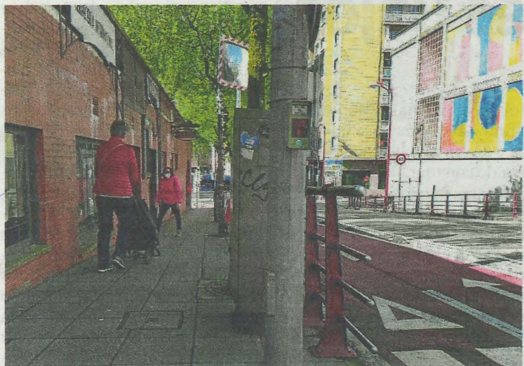
Los bidegorris son uno de los campos en los que actuará el Plan. A.L.

Todos los colegios locales de Educación Primaria participan en la actividad y se intercalan sesiones teóricas, en el aula, con las prácticas de campo. Participan una media de un millar de estudiantes cada curso.