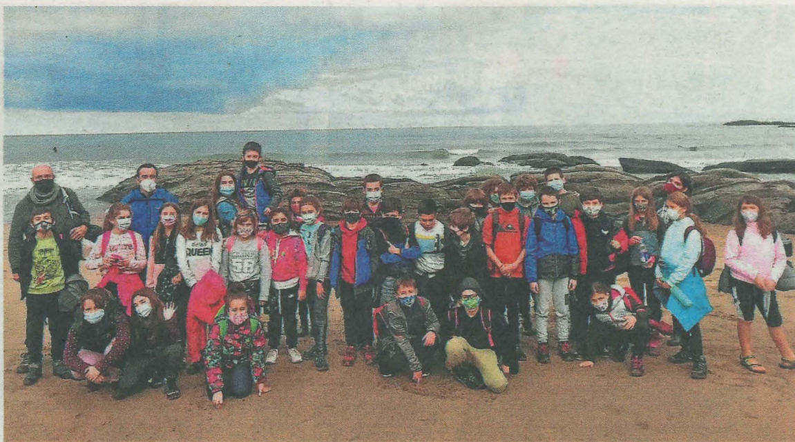
Una de las actividades con más éxito entre los escolares es la del análisis de la costa de Deba, Azterkosta.

En posteriores fases se establecerán los objetivos específicos, sus escenarios, se elaborará el proyecto de plan, se sacará a información pública y, por último, se redactará el PMUS.