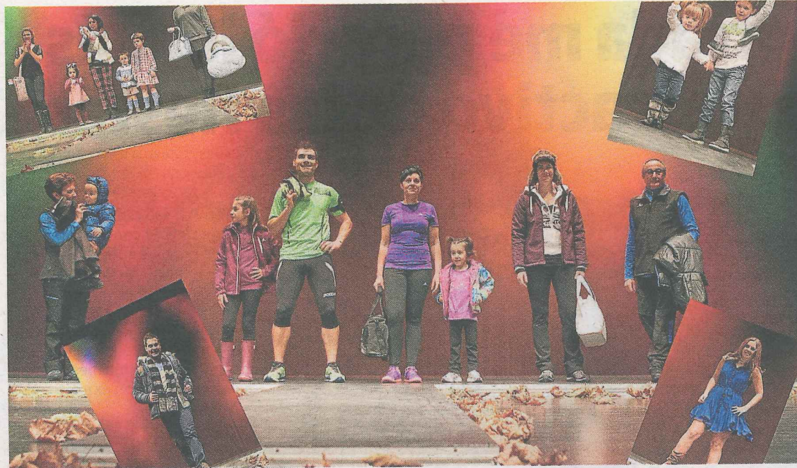
Montaje de la ACHE en una edición anterior del desfile solidario.

Además de demandar a la Organización Mundial de la Salud la eliminación de categorías que contemplan la transexualidad como enfermedad mental u otras categorías ofensivas. Por último, animan a la ciudadanía del municipio a mostrar su adhesión a estas iniciativas.