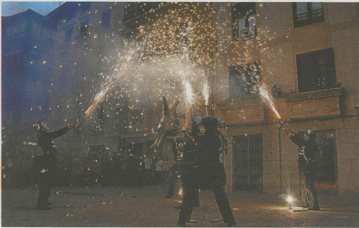
'Les Tambour de feus', Deban 2013. urteko Antzerki Astea.