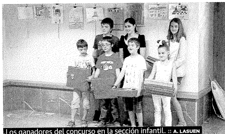
Los ganadores del concurso en la sección infantil.