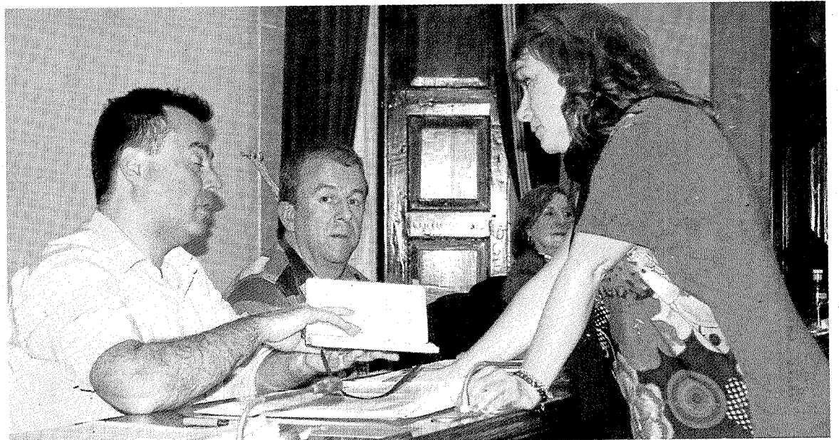
Miembros de los partidos de la oposición en un pleno anterior.

«Complicado analizar unos presupuestos que requieren de los pre-