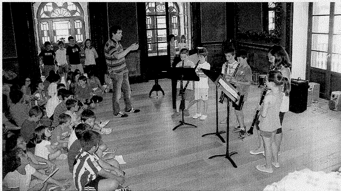
Alumnos de clarinete de Deba Musikal durante su intervención.