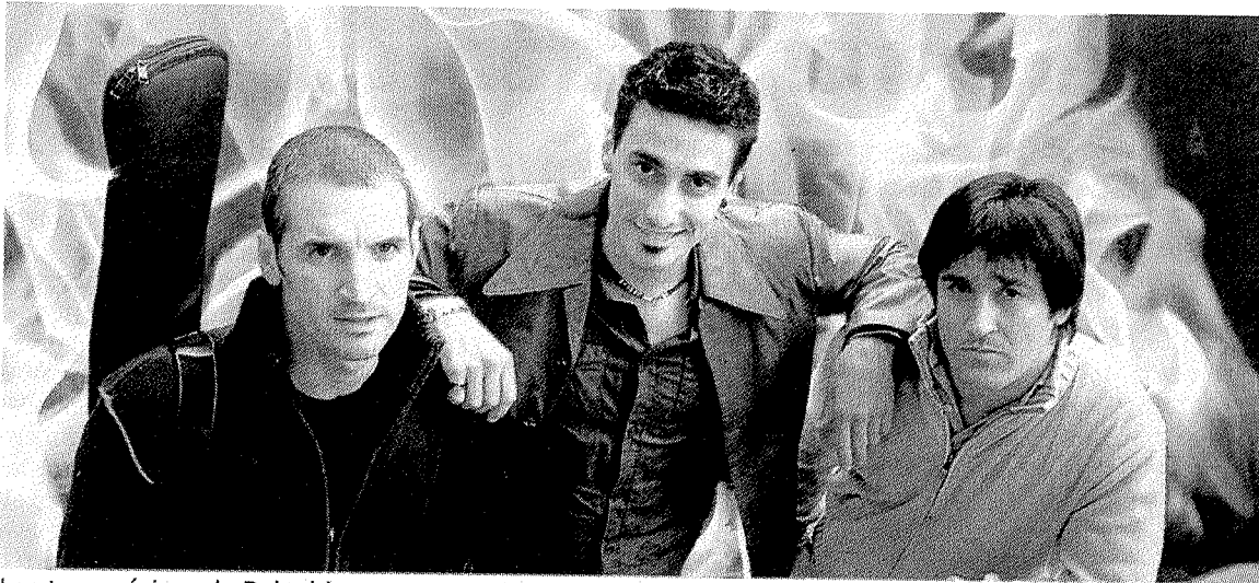
Los tres músicos de Belceblues en una imagen de un disco anterior.