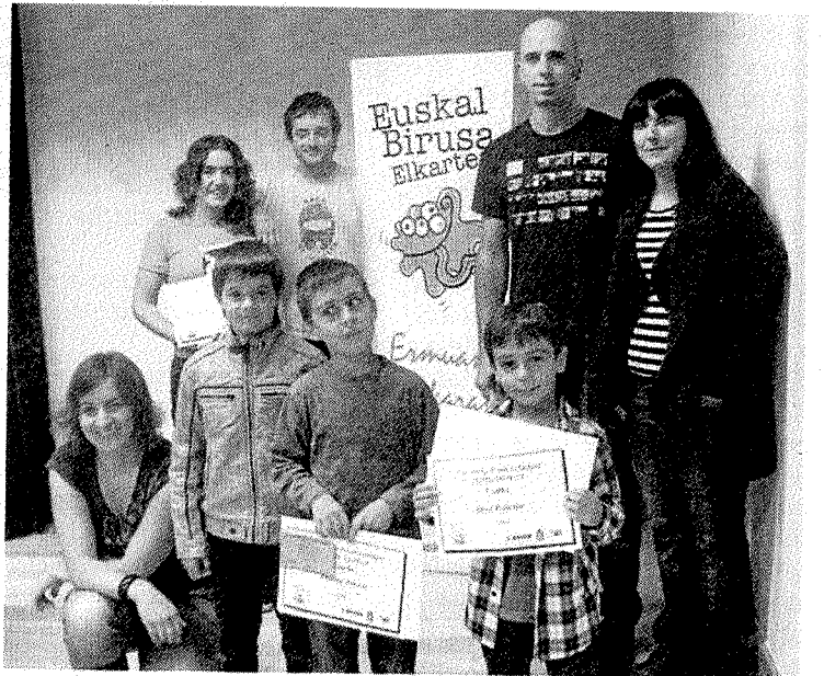
Ganadores de la anterior edición del concurso de postales. :: A. L.

En la categoría infantil, los autores de las tarjetas que resulten premiadas recibirán cheques compra por valor de 50, 40 y 30 euros respectivamente. Los premios se entregarán en un acto que se llevará a cabo el día 1 de octubre en los locales de Lobiano Kultur Gunea.