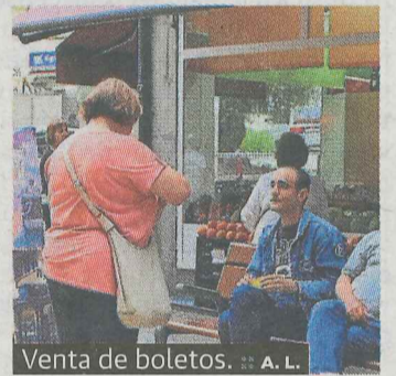
Venta de boletos. ■ A. L.

La programación festiva de 'Santigos 2017' continúa hoy con una novedad, ya que por la tarde se estrena 'Plaza irrintzika'. Se trata de un acto destinado al público infantil con música y danza, organizado por Euskal Birusa. Comenzará a las 17.30 horas, en la plaza 8 de marzo. A las 18.00 horas, en el polideportivo municipal, comenzará el Campeonato de Fútbol organizado por Skorpio FS. Los juegos de txarangas, con la final de soka-tira y la prueba de cubos, comenzarán a las 19.00 horas. A las 22.30 horas, se celebrará un festival de bertso-laris, organizado por Deba-Behoko Bertso Eskola. Participarán Beñat Ugartetxea, Arrate Illaro, Mirren Amuriza, Onintza Enbeita, Xabier Maia y Unai Mendizabal. Pondrá los temas Unai Rodríguez.