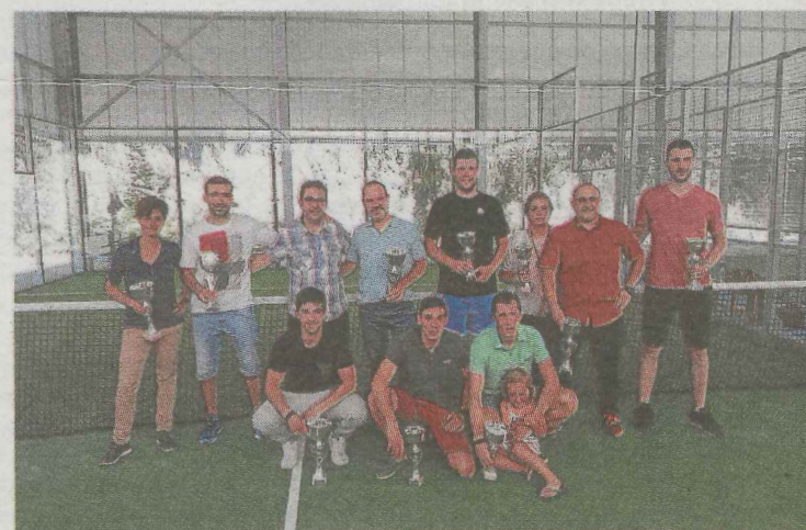
Entrega de trofeos a las parejas ganadoras.