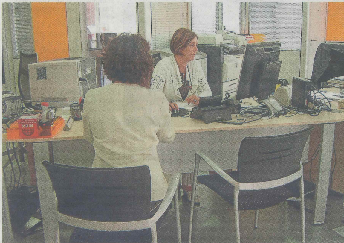
La relación con la ciudadanía, que se realiza en Abiapuntu, es uno de los indicadores a evaluar.

El objetivo es conseguir una organización más eficaz y cómo ser capaces de orientarse más a la ciudadanía