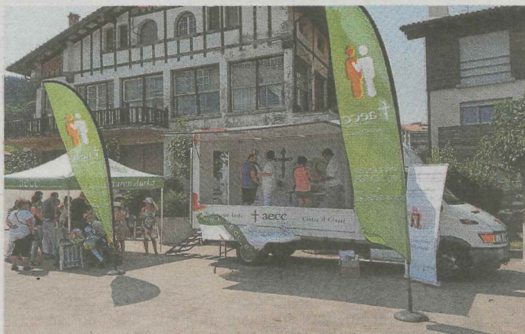
La unidad móvil de la AECC de Gipuzkoa. A.S.

El horario de esta campaña será de 10.00 a 13.00 horas. La ubicación de la unidad móvil dependerá de la presencia o ausencia de lluvia. En la