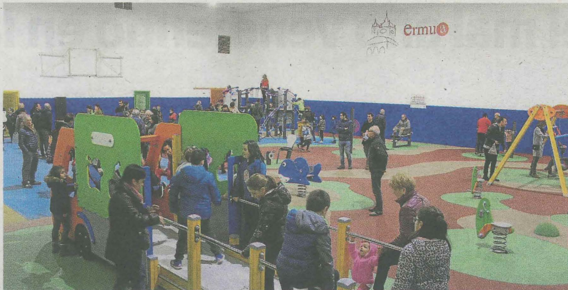
Inauguración de los juegos en el Centro Cívico Miguel de Unamuno.

Hoy y mañana se pondrán a la venta las entradas para el partido de pelota a mano de categoría profesional de los 'Santiagos 2018', que tendrá lugar el día 25 de julio, a las 17.00 horas. Estas se pueden adquirir entre hoy y mañana, en Lobiano, en horario de 18.00 a 20.00 horas.