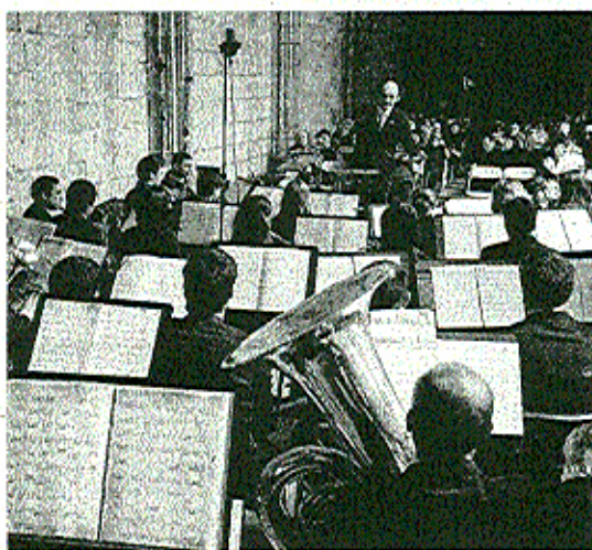
Bandaren kontzertua elizako klastroan arituko dira etzi.

Musika Bandako partaideak izango dira lehenak euren agerral- dia egiteko. Larunbatean izango da, eta elizako klastroan beraien instrumentuak entzungo dira. Ur- tero prestatzen dute kontzertu hau eta beti entzule asko biltzen dira. Ekitaldia 12:30etan hasiko da eta ordu bat inguru iraungo du. Egun honetan ez da musika entzuteko aukera bakarra, zeren eta Esteban Elizondo organoa joko baitu arratsaldeko azkeneko orduan.