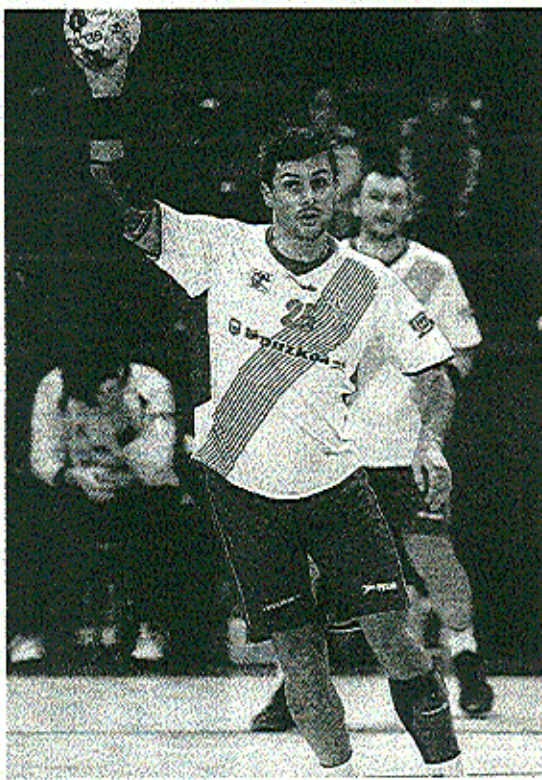
CUTURA. El capitán del Arrate logró marcar tres goles.

El conjunto navarro comenzó su recital defensivo, el guardameta Malik cuajó uno de sus mejores partidos y, al contraataque, fueron desgastando al rival. Las ventajas se fueron ampliando poco a poco merced al acierto de Malmagro,