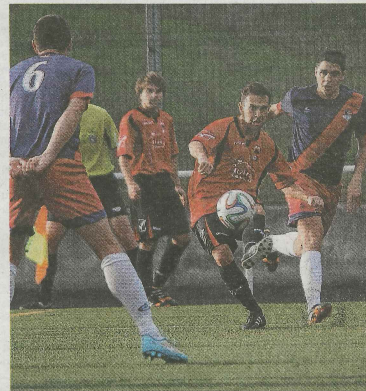
El Aurrera viaja con la moral alta a Zamudio. :: UNCITI

Y eso que el Aurrera se adelantó en el marcador, pero si se quedó con el regusto de haber podido sacar algo más frente a uno de los gallitos de la categoría. Independiente del resultado ante el Zamudio, el equipo está obligado a sumar puntos en los próximos encuentros para tratar de conseguir la salvación.