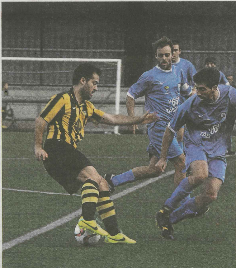
El Amaikak de Preferente juega en Arrasate.

Los cadetes están realizando una temporada de sobresaliente, fruto de ello se han colocado segundos,