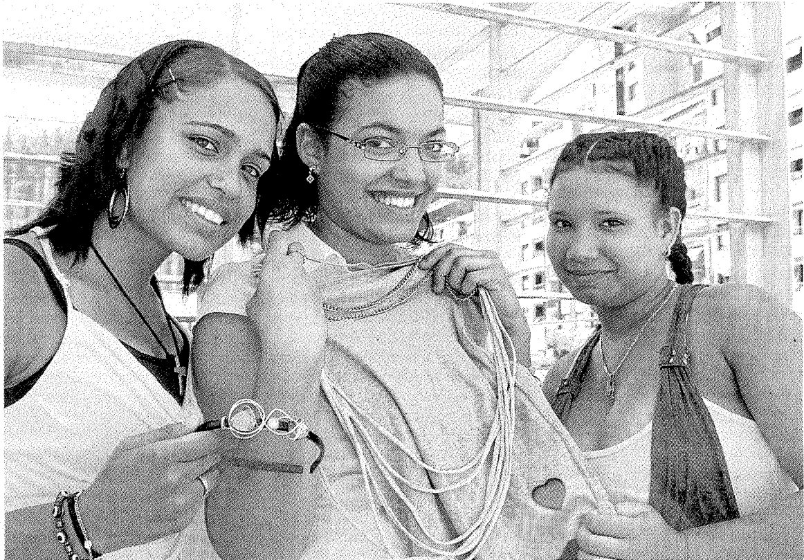
Las impulsoras de la nueva actividad empresarial tienen entre 16 y 18 años. ■ A. L.

Uno de sus distintivos es que la originalidad de todas sus piezas está garantizada «puesto que nuestro valor más importante es que tratamos de incluir elementos nuevos en todas», explican. También hay