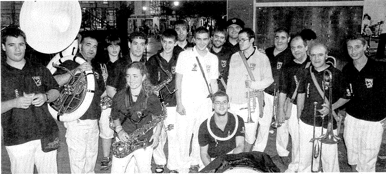
Los miembros de Irulitxa, antes de subir al escenario, aprovecharon para comerse el bocadillo de la 'bocadillada'. :: A. L.