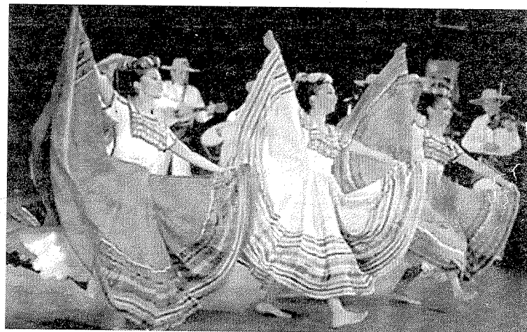
Folklore Bizian jaialdian izango da Zacatecas dantza taldea.

biltzen dute, udare forma duen gitarra itxurako instrumentu soka-duna. Jantzi ikusgarriak erakutsiko dituzte.