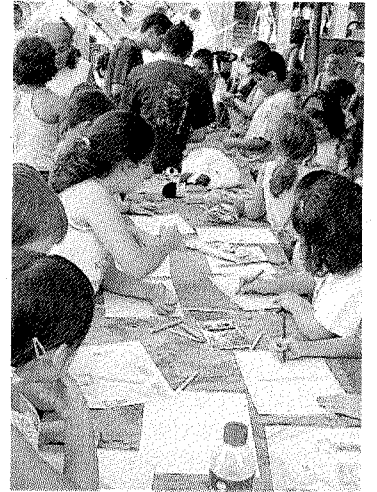
Niños en los talleres. ::

Hoy miércoles siguen las 'olimpiadas' de las txarangas con las pruebas del pecado original y la de cubos, a las 19.00 horas en la plaza, y ya por la noche, en el parque Marqués de Valdespina, el colectivo ermutarra Komite Internazionalistak nos trae al grupo percusionista africano 'Africa Baj Yai', a las 22.30 horas.