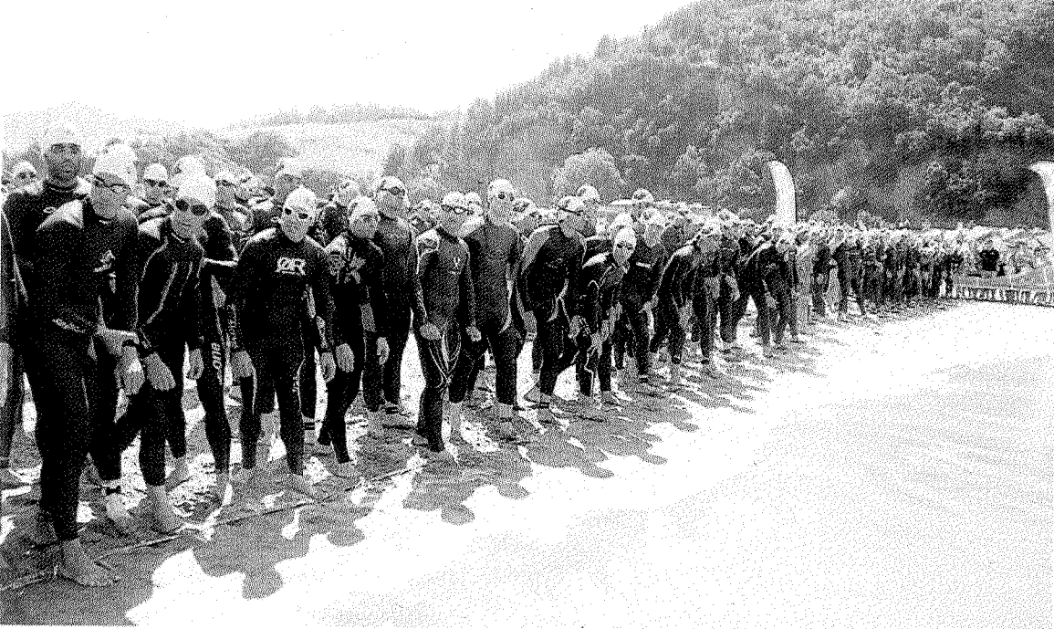
Deba-Itziar Triatloiko hasiera hondartzan egin zen, Igeriketa Zeharkaldian bezala. :: ANDER SALEGI