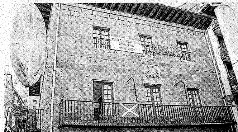
Bandera escocesa en el Ayuntamiento de Soraluze. ** ISASTI

El PSE-EE ha criticado que el equipo de Gobierno, formado únicamen-