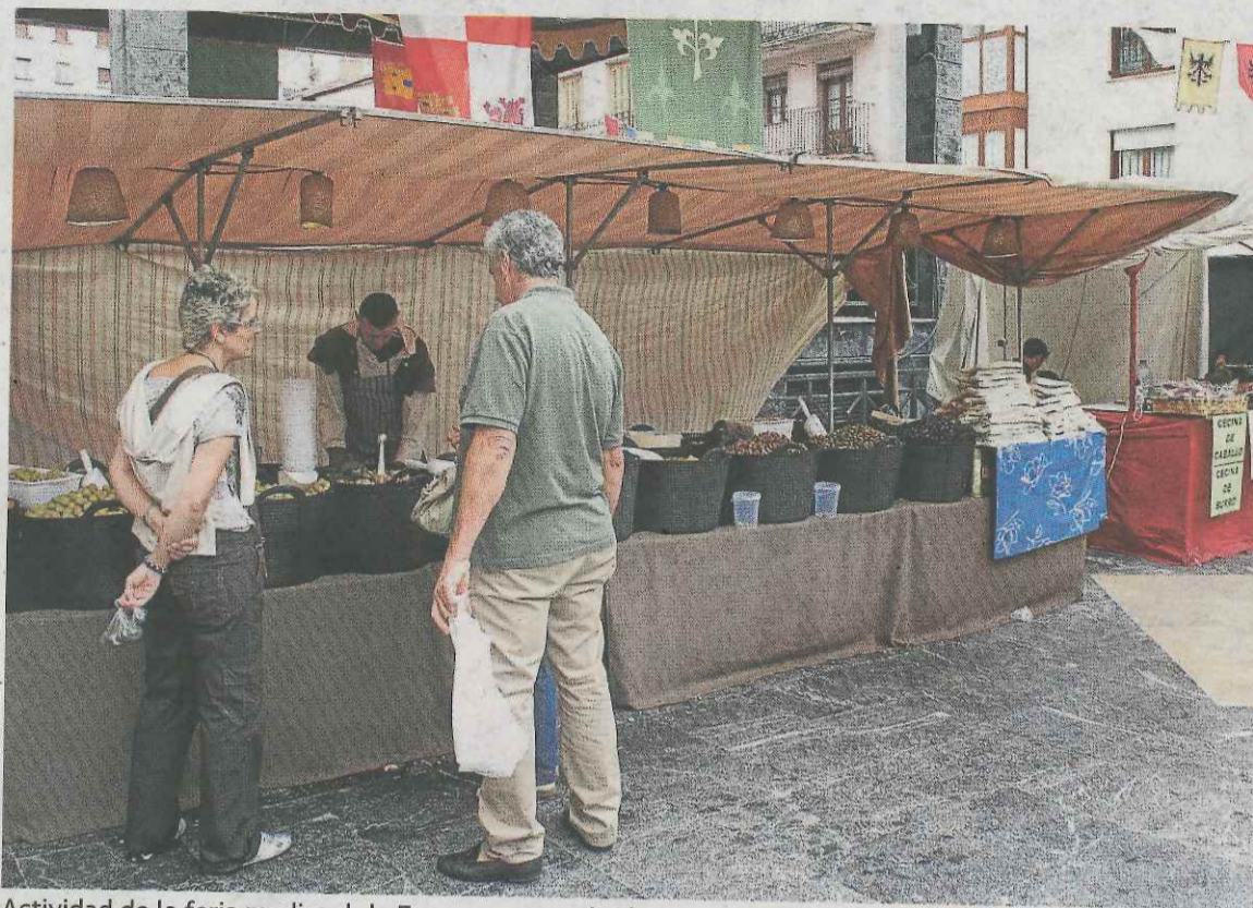
Actividad de la feria medieval de Ermua en una edición anterior.

Si bien el recorrido es el mismo que en anteriores ediciones, desde la organización se han incluido varias novedades en la actual edición. En primer lugar, las inscripciones de la carrera de adultos este año se deberán realizar a través de la página web www.kirolprobak.com hasta el día anterior de la prueba. No se podrán realizar inscripciones el mismo día de la carrera, en la disciplina adulta. Los deportistas más jóvenes podrán hacerlo durante la misma jornada de celebración de la prueba.