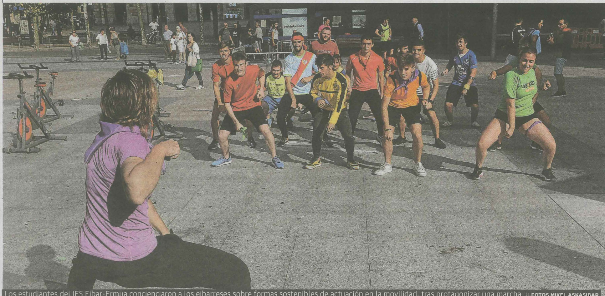
Los estudiantes del IES Eibar-Ermua concienciaron a los eibarreses sobre formas sostenibles de actuación en la movilidad, tras protagonizar una marcha.