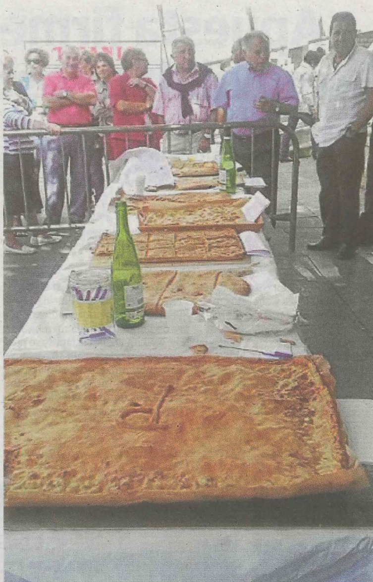
La empanada regresa a Ermua de la mano del Centro Gallego. ■ A. L.

Ermua celebrará mañana la Fiesta de la Empanada organizada por el Centro Gallego. Esta jornada que ya