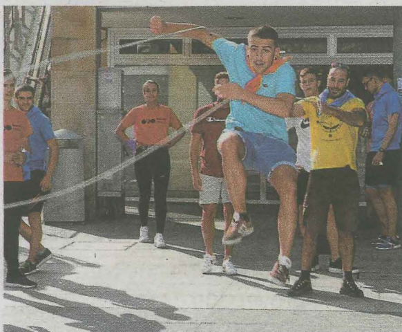
Hubo espacio para realizar diferentes juegos.