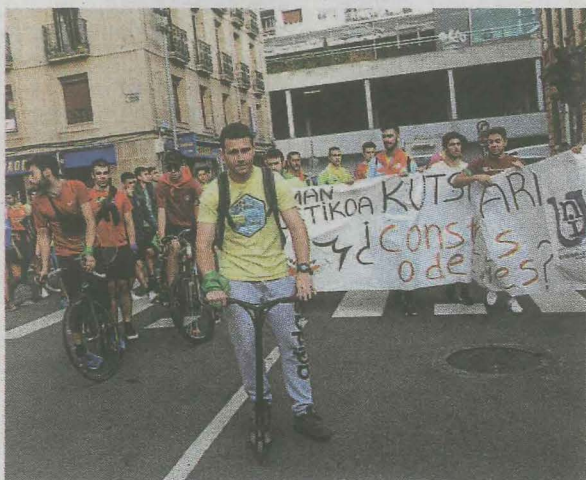
Inicio de la marcha de los jóvenes.

El servicio es gratuito y no se aceptarán precios superiores a 400 euros. Más información en el número 943670249.