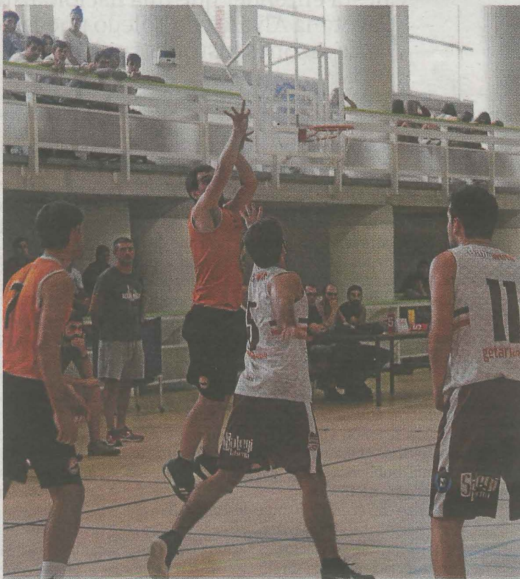
Eñauten jauzia jaurtiketa baterako. :: A. SALEGI

Azkenik aipatu behar asteburu honetan Debasketeko Gora Behera