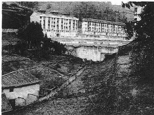
El desarrollo del área del convento ha despertado un gran interés. [A.G.]

MUTRIKU. DV. El Ayuntamiento de Mutriku por medio de un decreto de Alcaldía ha aprobado con carácter inicial el estudio de detalle del área AR-6 conocido popularmente como el área 'Santa Katalinako Komentua'. El acuerdo se someterá a información pública en un periodo de veinte días tras su publicación en el Boletín Oficial de Gipuzkoa para que así pueda ser examinado y consecuentemente se puedan presentar las alegaciones que se consideren oportunas. En la misma resolución se adopta igualmente el compromiso para informar al respecto en la siguiente sesión plenaria que se vaya a celebrar que siempre que se mantenga el calendario habitual se celebraría el próximo