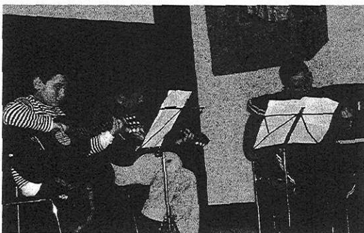
Los alumnos de la Musika eskola de Mendaro. [EGAÑA]

Por este motivo se invita a todos los vecinos de Mendaro, para que acudan a la mencionada función de mañana donde estos jóvenes promesas esperan ofrecer un selecto y atractivo concierto Navideño. ■