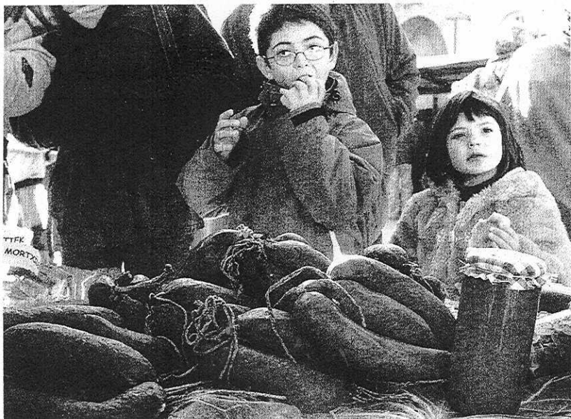
TRADICIÓN. Unos niños, ante un puesto en el que se exhiben morcillas.