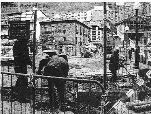
Varios operarios trabajan en las obras del puente Izartu.

Con motivo de las obras de urbanización a realizar a la altura del número 17 de la calle Rabal,