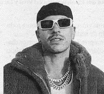
Arriba, el músico urbano Feid, que actúa esta noche en el Bilbao Arena.

Habrà que esperar al sábado, pasada su madrugada y abonar 25 euros para disfrutar de la música de Charanga Habanera, el combo que David Calzado —músico graduado en la Escuela de Arte de Cuba— impulsó a finales de los 80. Desde entonces, su dominio de la música tradicional de su país de mediados del siglo pasado, del guagancó a la rumba,