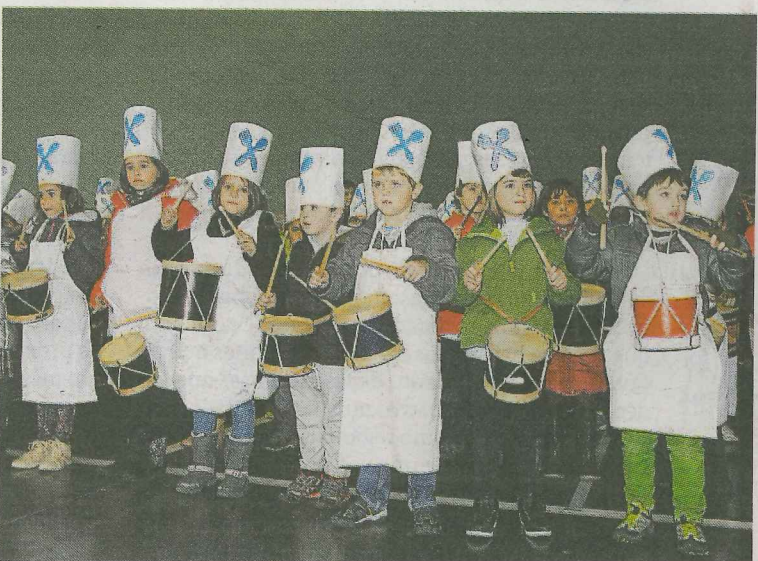
Los escolares entraron en calor tocando las marchas de Sarriegi.

mo y cuando finalizaron se ganaron los aplausos del público.