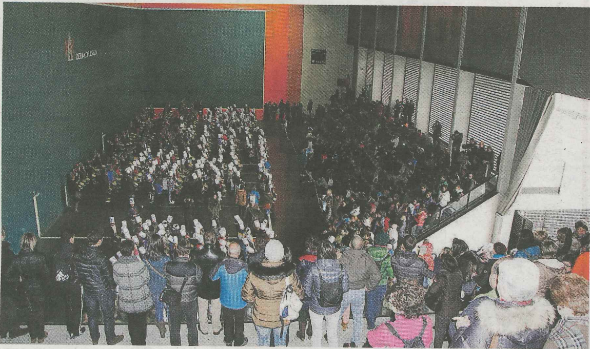
La cancha del frontón Aldats se llenó de tamboreros y las gradas, de familiares.