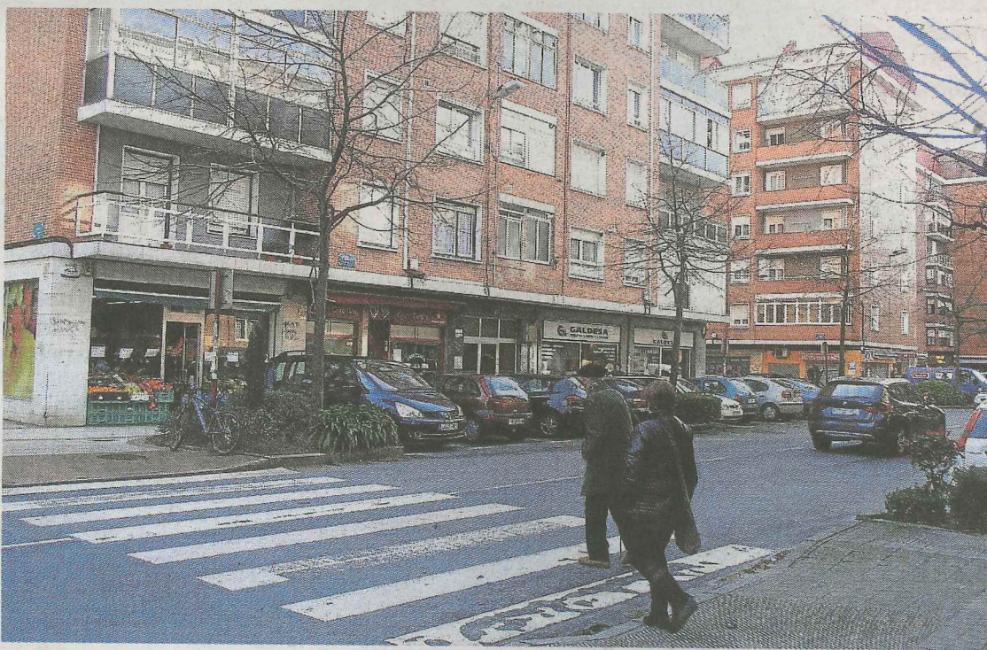
Imagen de una calle de Getxo, municipio en el que se han reforzado las ayudas.

TERCERA EDICIÓN Desde el Consistorio ermutarra se mostraron muy satisfechos con la respuesta de la ciudadanía y el transcurrir de las clases en esta segunda edición. “La experiencia ha vuelto a ser muy positiva y el año que viene probablemente se repita el curso”, zanjaron sus organizadores. Habrá pues, una nueva oportunidad para aprender entre fogones. ●