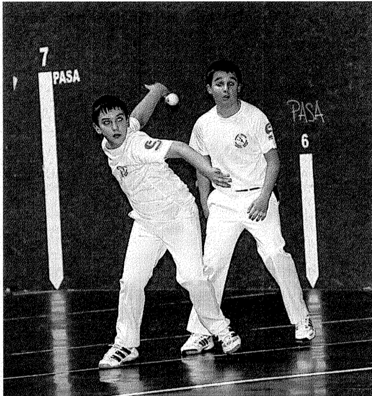
El frontón Aldats acogerá esta tarde nuevos partidos. ANDER SALEGI

Los infantiles sufrieron ante el líder, el Aurrera Saiaz. Urkiri y Arakistain no pudieron seguir el ritmo