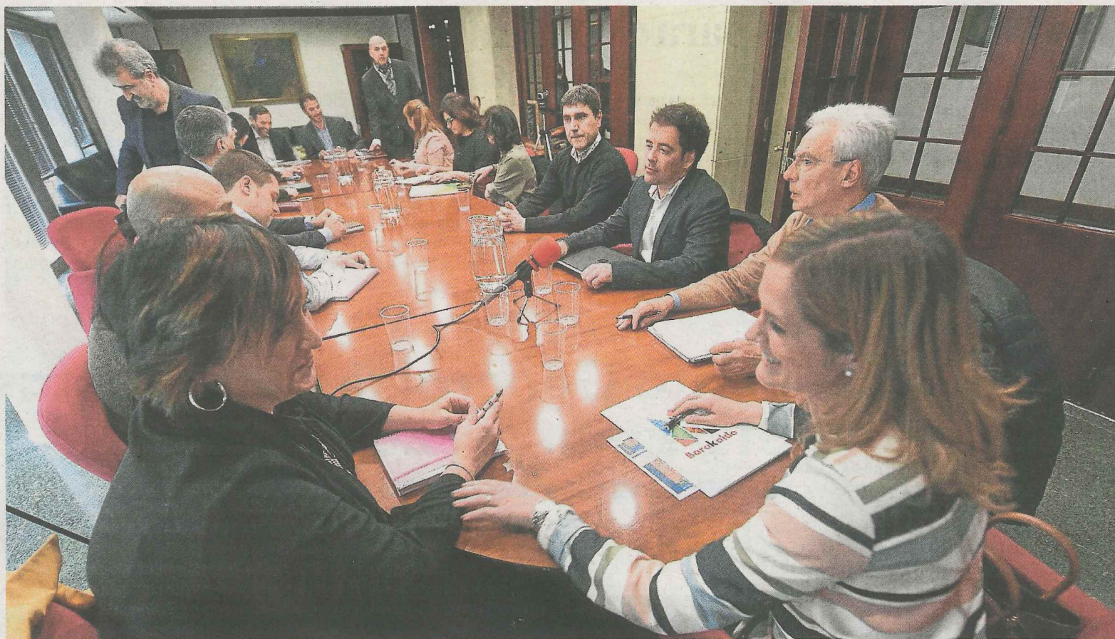
Alcaldes y concejales de los diferentes municipios se reunieron ayer en Barakaldo.

“Con esta campaña se quiere implicar a la familia, porque para que la enseñanza de una lengua tenga éxito es condición indispensable el compromiso de toda la comunidad educativa. La experiencia de la inmersión en una segunda lengua será exitosa cuando toda la comunidad educativa esté motivada e implicada”, aseguran desde el Consistorio para explicar la campaña. “Para crecer en euskera es necesario que el entorno ofrezca estímulos en esa misma lengua desde la infancia”, finalizan. — E. P.