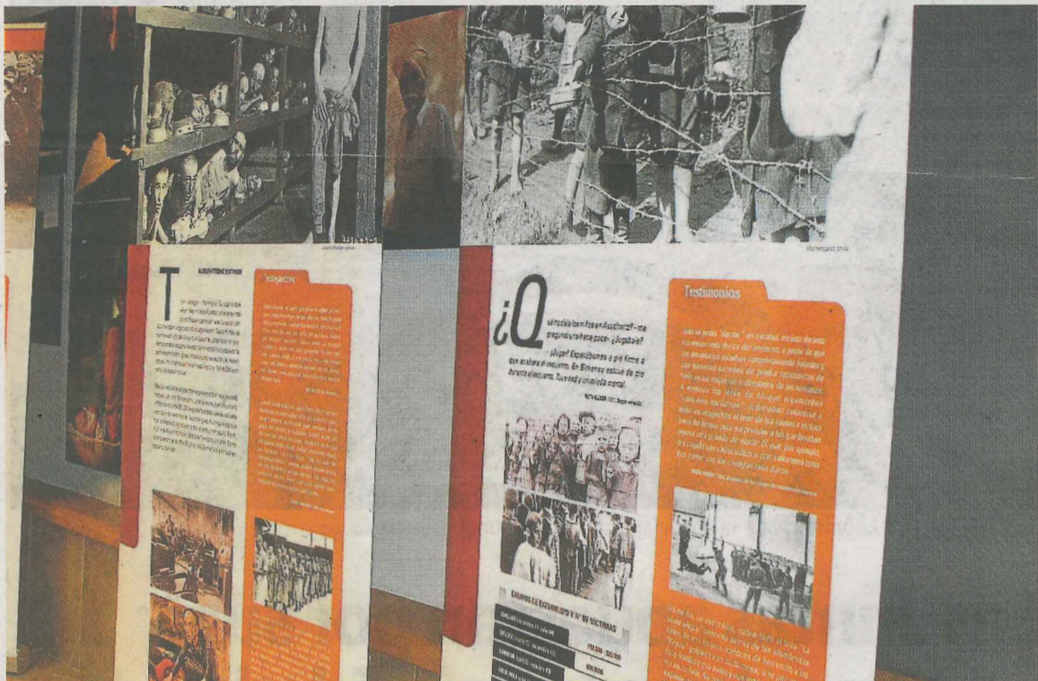
Exposición en una anterior edición de las Jornadas contra el Racismo en Ermua.

El programa de actividades dirigidas a la población para introducir el debate y la reflexión en torno a esta temática comenzaron ayer lunes con la apertura de la exposición