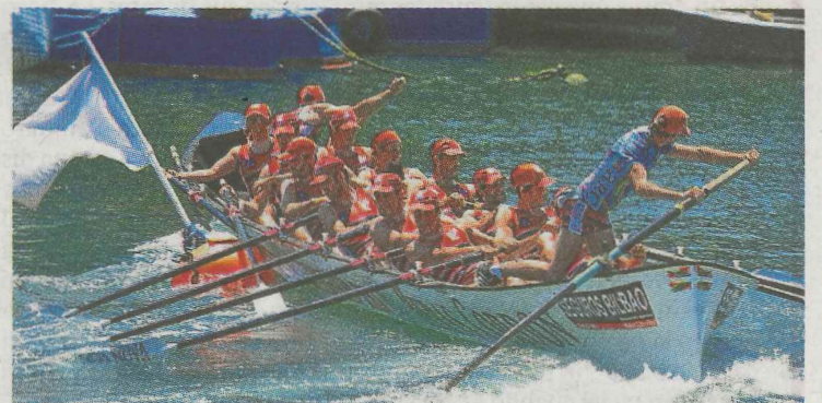
Ondarroa quedó tercera en el descenso del Nervión.

Ondarroa quedó tercero en el II Memorial Camiruaga 'Cami'-XVII Memorial Jon Sasieta 'Bilba', celebrado en la Ría del Nervión. Las embarcaciones de Bermeo, en categoría masculina, y Deusto, en la femenina, lograron la victoria en este descenso, organizado por el Club de Remo Deusto. En hombres, Bermeo marcó un tiempo de 20.13:19 que le sirvió para aventajar en algo más de cinco segundos a Kaiku, segundo, y en 21 a Ondarroa, que completó el podio. A continuación se clasificaron, por este orden, Zirbena, Ares, Deusto A, Lekittarra, Portugalete, Kaiku B, Arkote, Mariñeiro de Mera, Deusto B, Lutxana, Getxo y Donostiarra. En la prueba femenina, las anfitrionas de Deusto, con un tiempo de 13.15:71, han superado a Portugalete (+5.69) y a Lea Artibai (+1.04:93).