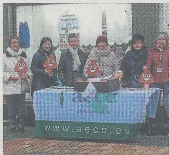
Mesa informativa. ■ A. L.

De 18 a 20 horas, las voluntarias instalaron una mesa informativa en la plaza Cardenal Orbe, donde entregaron naranjas cortesía de Mercabilbao, tratando de trasladar pequeños gestos para una vida sana y ahondando en la idea del lema de este año: 'Ponte un reto saludable y manda el cáncer de colon a la mierda'. Uno de los retos saludables que recomendaban era el de «comer más verdura a la semana».