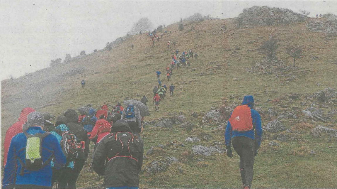
Los participantes en la marcha, en plena subida a Gaintxipixa. ANDER SALEGI

Muy temprano, a las 7.30 horas 500 personas iniciaron la marcha desde Lastur, cuya primera ascensión fue el monte de Gaintxipixa. Después el recorrido transcurrió por otros altos como son Otarre, la cruz de Aittola, Salsamendi, Andutz, Arbil. Los bastones, paraguas, chubasqueros y botas fueron los mejores complementos de los participantes. Hubo oportunidad de completar dos recorridos diferentes, uno de 20 kilómetros y el otro de 28, algunos lo hicieron corriendo y otros andando. Hasta Esteixa todos los deportistas compartieron recorrido, pero en ese punto se dividieron, los de la vuelta corta, se dirigieron hacia Lastur, mientras que los de la larga tomaron rumbo a Salsamendi, Andutz y Arbil.