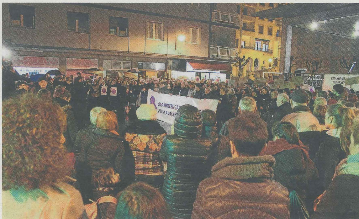
Imagen de una concentración anterior en Ermua contra la violencia machista.