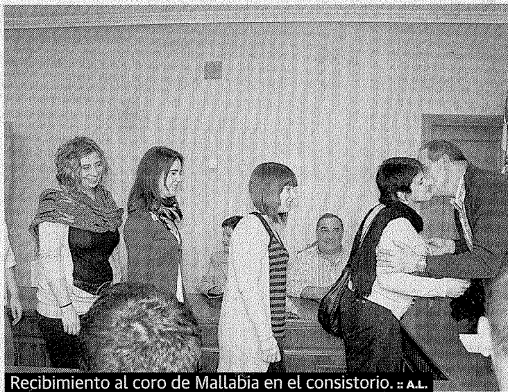
Recibimiento al coro de Mallabia en el consistorio.