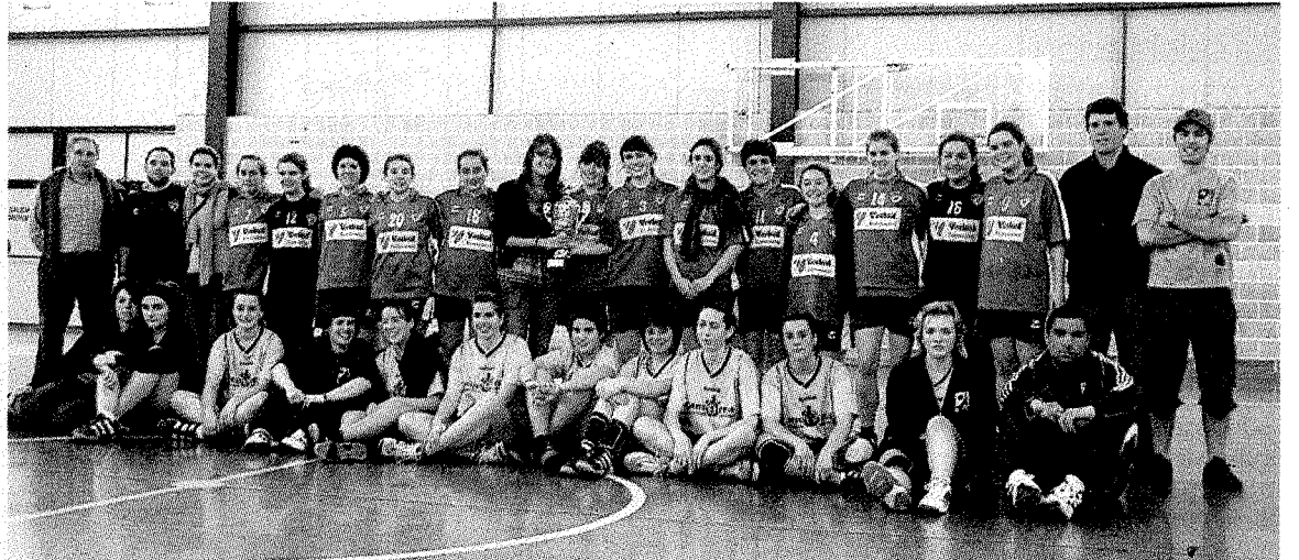
Plantilla, directivos y equipo técnico del Jauja de balonmano con el trofeo.

La práctica del baloncesto también se va consolidando en el municipio, y como muestra el gran partido que disputaron los miembros del equipo cadete masculino de Mutriku,