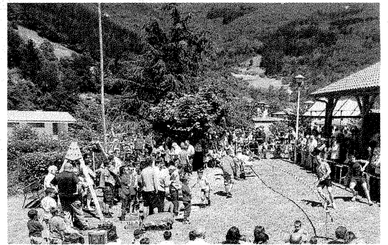
El deporte rural congregó a cientos de vecinos en la ermita. ■ LAZKANO

Como manda la tradición, cantaron con gran interés las coplas que han venido preparando durante las últimas semanas, ante la atenta mirada de sus amigos, padres y demás familiares.