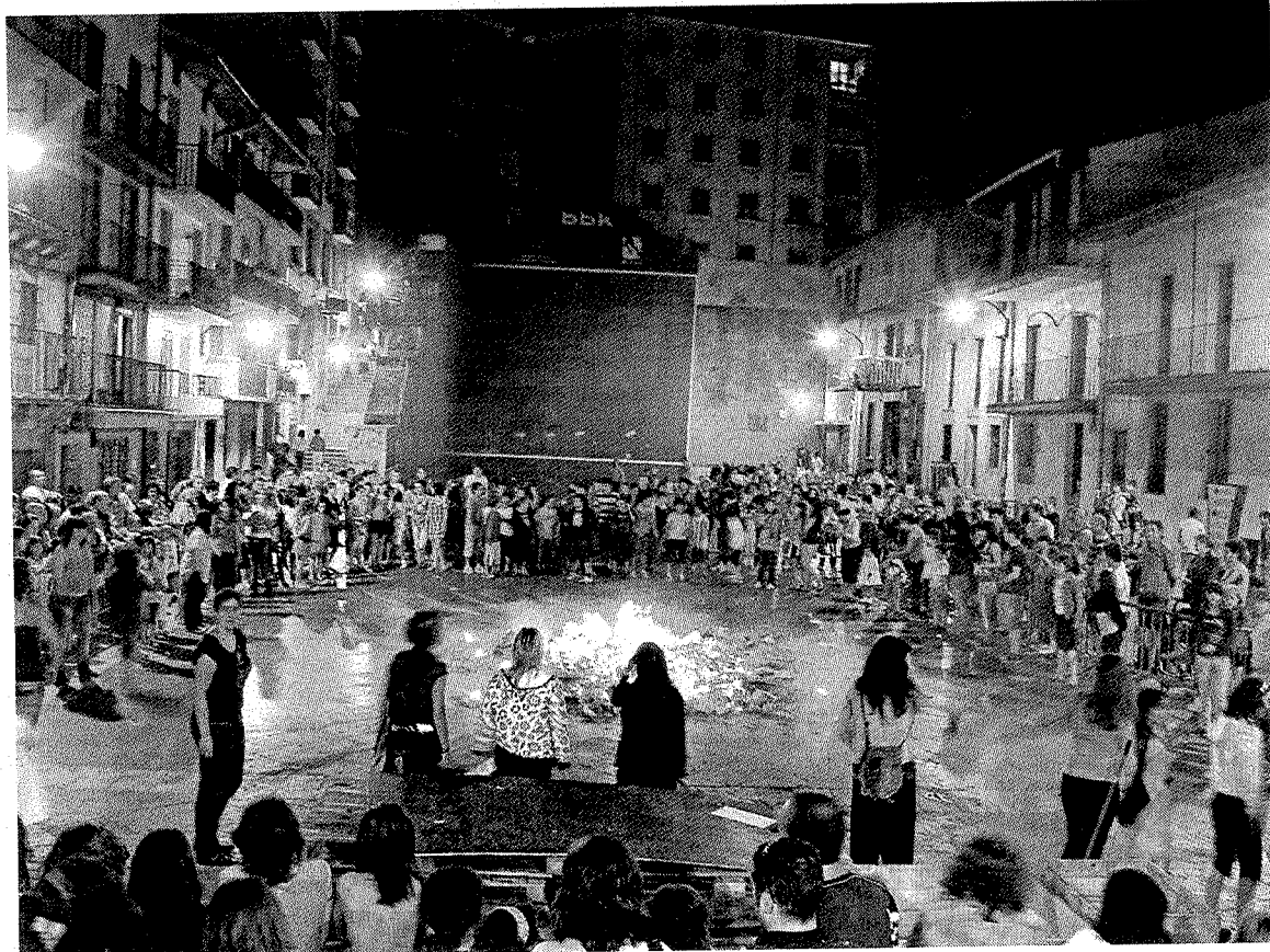
Numerosos ermua-rras bailarían en torno a la hoguera de San Juan en esa mágica noche. :: A. L.

En esta edición se repetirá además la suelta de los 'zezen txikis'. Se tra-