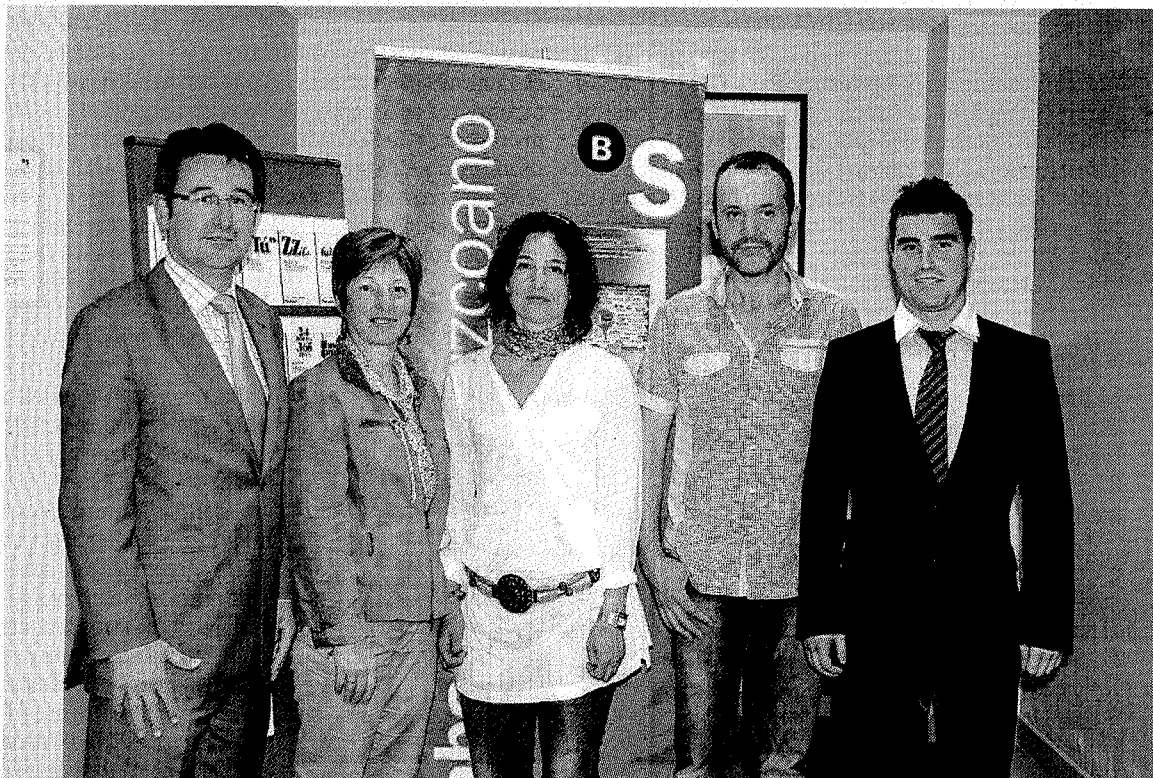
Representantes del Banco Sabadell Guipuzcoano y de Debalai, en la firma del convenio. ** ANDER SALEGI

Aquí no se detienen las actividades que la agrupación de comerciantes y hosteleros tienen ya pensadas. Para el mes de julio se van a organizar otras iniciativas que tienen la finalidad de apoyar al comercio local de Deba.