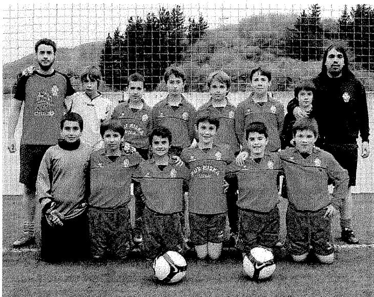
El equipo alevín de Ermua participa en el torneo intercomunidades.