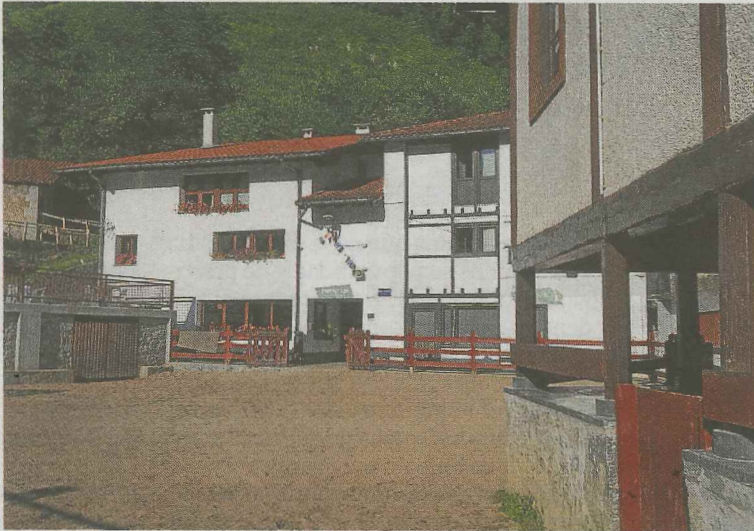
Lasturko aterpetxea hitzaldia egingo da hitzaldia. :: ANDER SALEGI

Magiaz betetako egun hauetan, 'Udako Solstizioa'-ri buruz hitz-egin- go du. Zeintzuk ziren herri zaharren ospakizunak? Zer zen solstizioa? Zer gertatu zen kristau erlijioa zabaldu zenean? Zeintzuk ziren Euskal Herriko errito, sinesmen eta ohiturak solstizioari lotutakoak? Galde- ra hauen erantzuna ematen saiatuko da Aritzak. Orain dela gutxi arte bizi iraun duten datu guzti