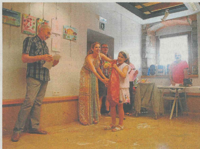
La mayoría de las participantes fueron niñas. :: X. C.