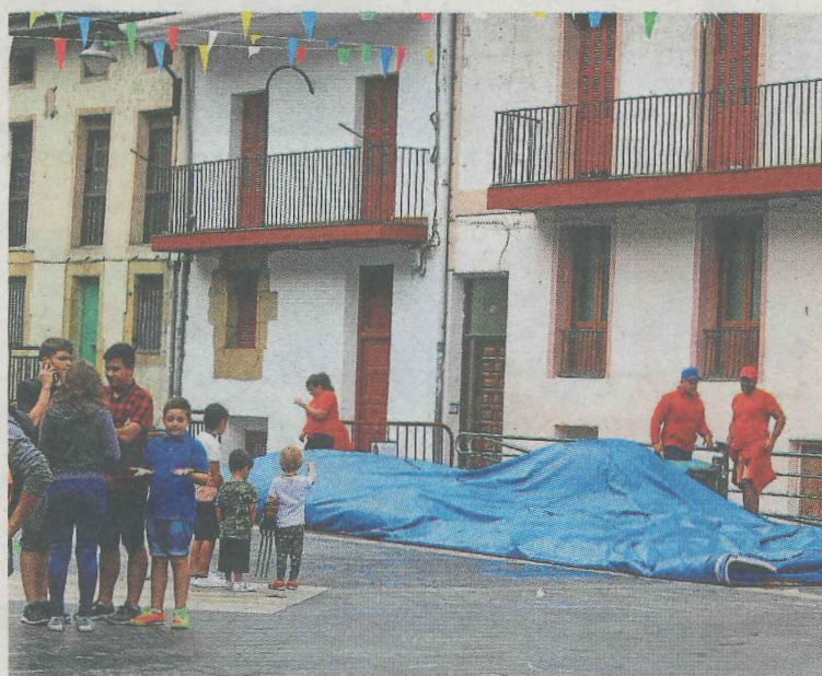
Los hinchables se retiraron por la lluvia, ante el disgusto general.

*EL CORREO no se hace responsable de cambios de última hora