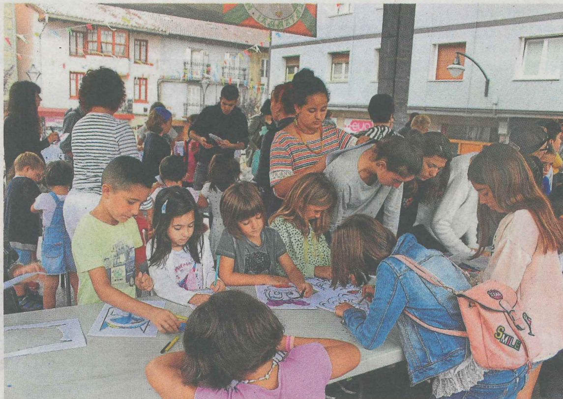
Los más jóvenes se afanaron en los trabajos de pintura, pero eso sí, a cubierto.

A las 22.30 horas comenzará en la plaza Cardenal Orbe el tradicional concurso de playback.