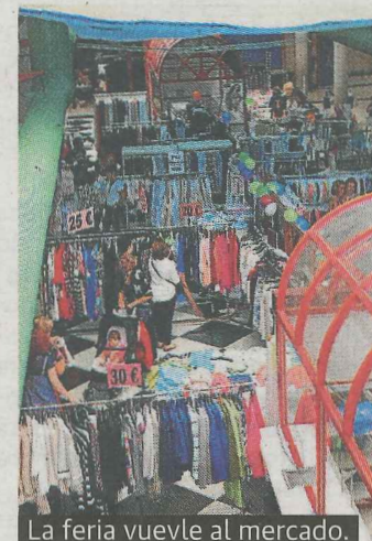
La feria vuelve al mercado.

:: La Asociación de Donantes de Sangre de Ermua, Donaser, organiza para mañana sábado una sesión de donaciones en la villa. Esta complementará la ya realizada el pasado jueves en su sede de la Avenida de Bizkaia. La unidad móvil de la asociación se instalará mañana en horario de 9.15 a 14.00 horas en Zubiurre (junto al Herga).