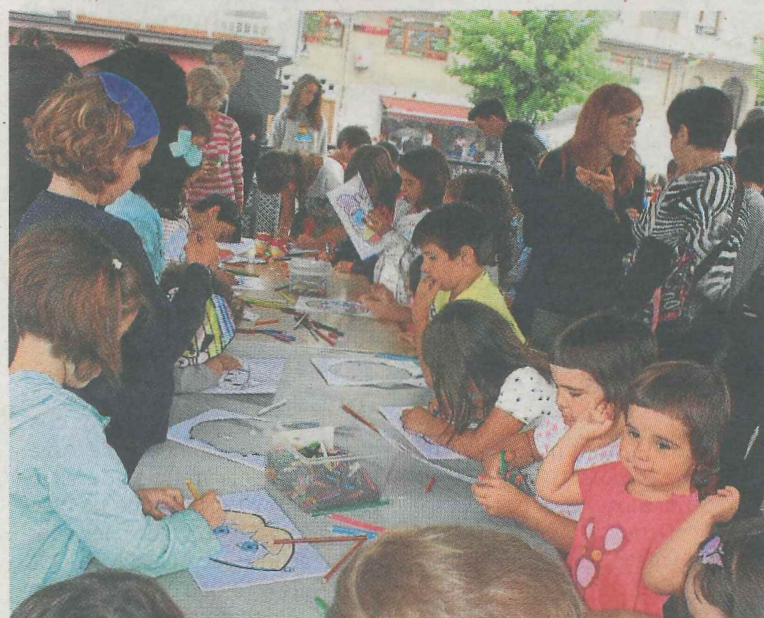
La población infantil disfrutó de la jornada matinal.