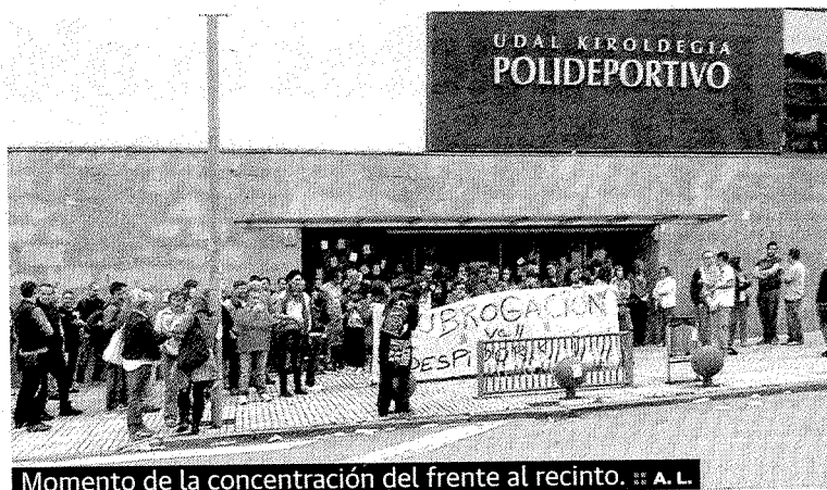
Momento de la concentración del frente al recinto.

to de Ermua que les ayude en su situación, llegaron el pasado 1 de septiembre a trabajar y se encontraron que ya no tenían su empleo. Esta situación se ha producido en el momento de cambio de empresa adjudicataria del servicio de recepción en el Instituto Municipal de Deportes (IMD). Las jóvenes afectadas agradecen su apoyo a las personas que les acompañaron el jueves en la concentración y aseguran que «seguiremos movilizándonos».