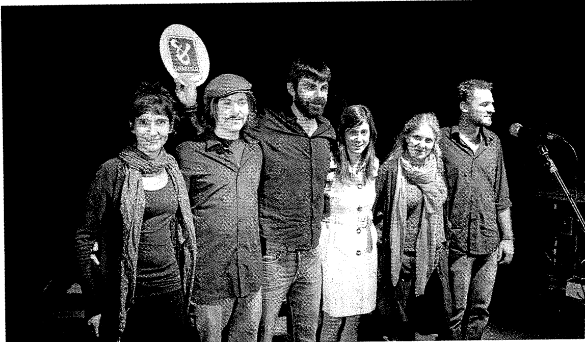
Los integrantes del grupo mallorquín reciben el premio en Ermua.

Lo único que nos sorprendió un poco fue tener que traer el back-line (batería, amplificadores,...), pero sólo porque nos cuesta mucho. Para llegar a Ermua tuvimos que coger un barco, una furgoneta y venir desde Valencia. El festival nos pareció fantástico, tanto organización, como el nivel de los grupos invitados y los del concurso.