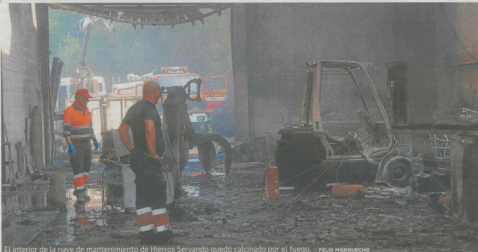
El interior de la nave de mantenimiento de Hierros Servando quedó calcinado por el fuego.