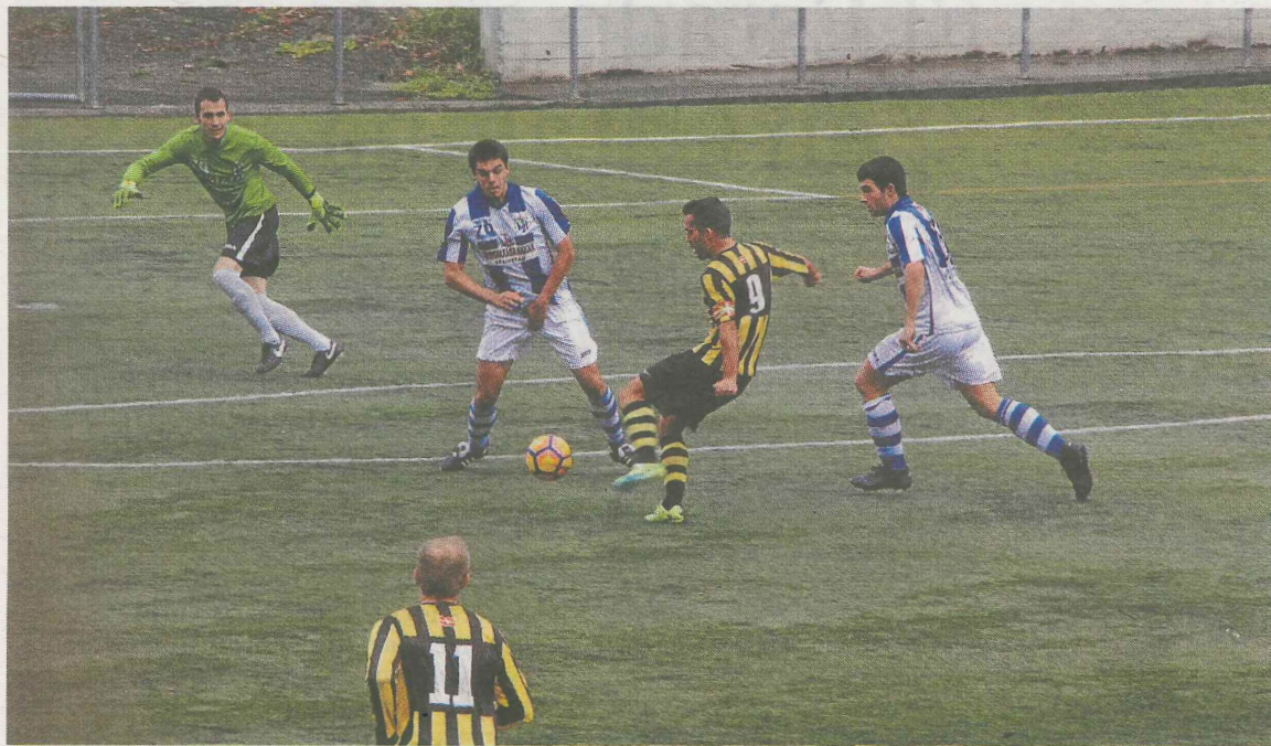
Jugada en la que Manci realiza la vaselina ante el Mutriku.