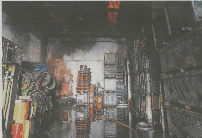
Un local de Metales Arroyo también se vio afectado.