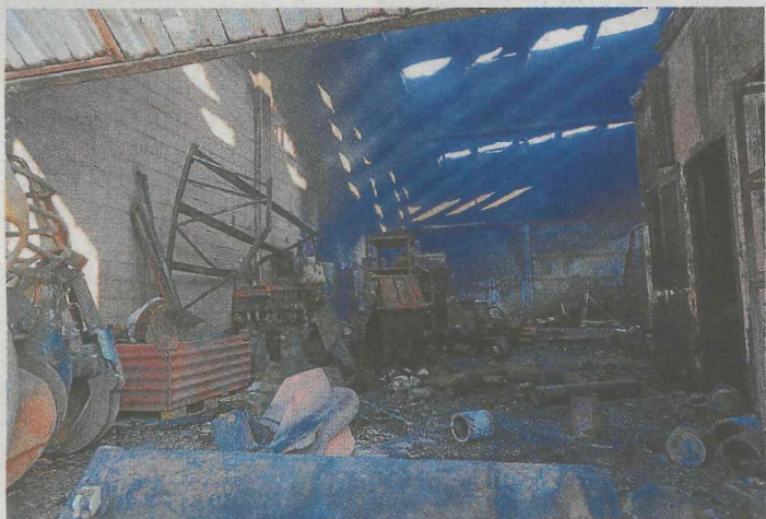
El pabellón incendiado, visto desde la entrada.