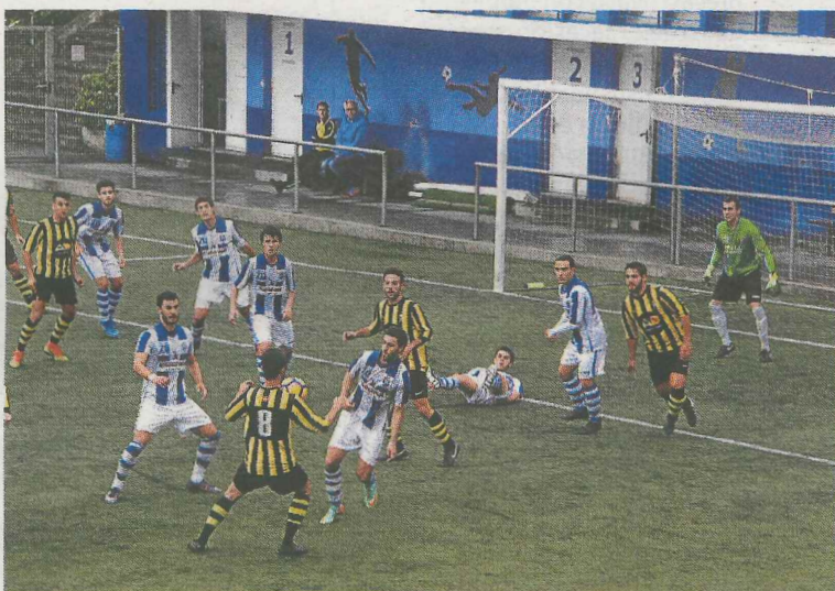
El partido ante el Mutriku fue intenso aunque no hubo goles.