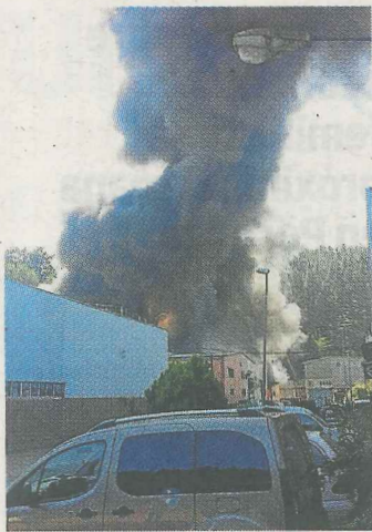
La humareda del incendio.